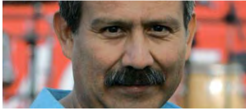
Hernando Calvo Ospina, escritor colombiano. (pág. 9)