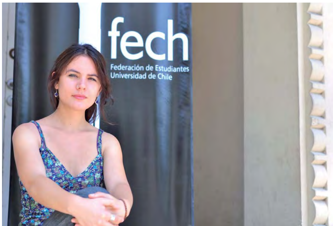
Camila Vallejo, presidenta de la Federación de Estudiantes de la Universidad de Chile y portavoz estudiantil.

Hoy, muchos de aquellos "pingüinos" están en la universidad y han contribuido al desmoronamiento de la gran coartada del neoliberalismo: la inexistencia de alternativas a las políticas sociales y económicas hegemónicas. En los últimos meses, centenares de miles de personas han recorrido las principales calles de Chile para exigir el derecho a una educación pública de calidad y gra-