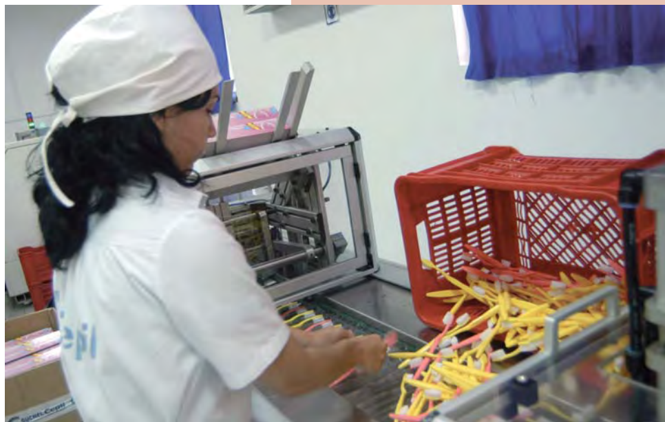
Empresa de artículos plásticos Suchel—Cepil, perteneciente a la Industria Ligera, en Ciego de Ávila.

Pero más allá de estos hechos, la actual realidad cubana continúa su curso de suma lenta y constante de cambios y reformas con un perfil apa-