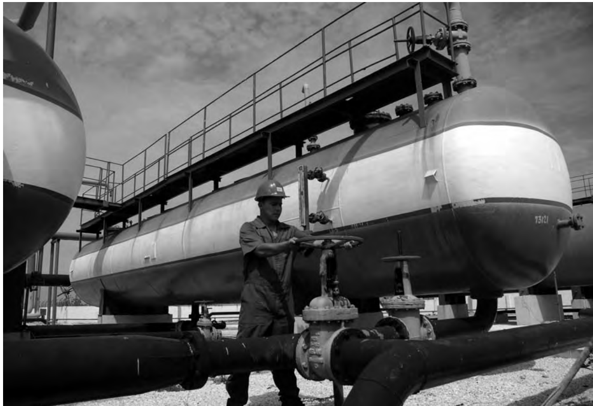
Unidad Boca de Jaruco, de la Empresa de Perforación y Extracción de Petróleo de Occidente, La Habana.

A pesar del bloqueo que impide que empresas estadounidenses hagan negocios en Cuba, un comité