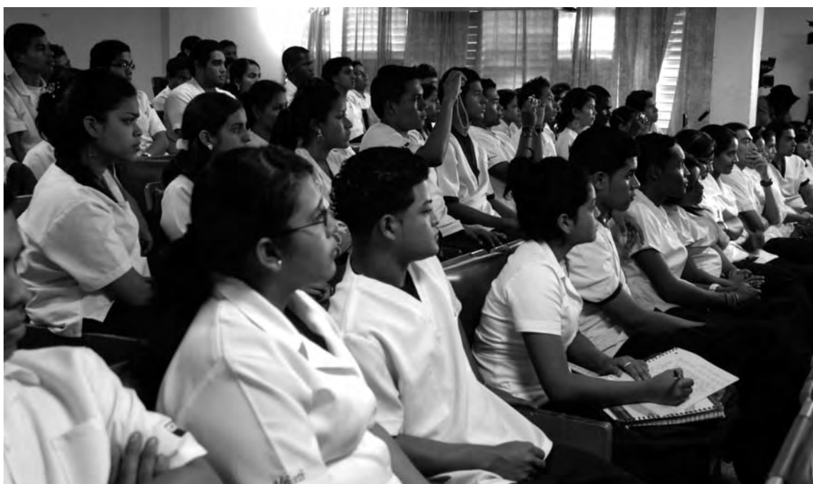
Estudiantes de la Escuela Latinoamericana de Medicina (ELAM), noviembre de 2010.

El informe fue presentado en México por representantes de Amnistía Internacional, del Servicio Cristiano de Solidaridad Monseñor Óscar Romero y del Movimiento de Solidaridad con Cuba en México