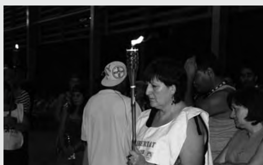
Vigilia por Los Cinco en Rubí (Barcelona) Una de las acciones de la jornada Cubanejant, del Casal d'Amistat amb Cuba de Rubí, 10 de septiembre

Estas son algunas de las decenas de actividades recientes por los Cinco Héroes cubanos, en todo el mundo: