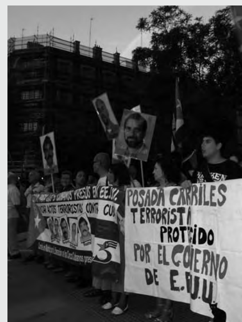
Se entregaron 50.000 firmas en Embajada de EEUU en Madrid Imagen de concentración del Comité de Madrid por Los Cinco, 12 de septiembre