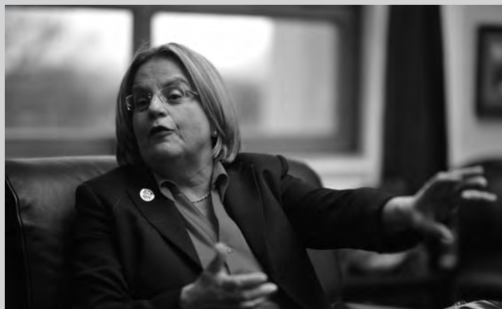
Ileana Ros-Lehtinen preside el Comité de Relaciones Exteriores del Congreso.

La carta advirtió a Repsol de que sus planes de perforación en Cuba podrían violar las leyes de EEUU —entre ellas una compleja red de sanciones que constituyen el bloqueo comercial contra