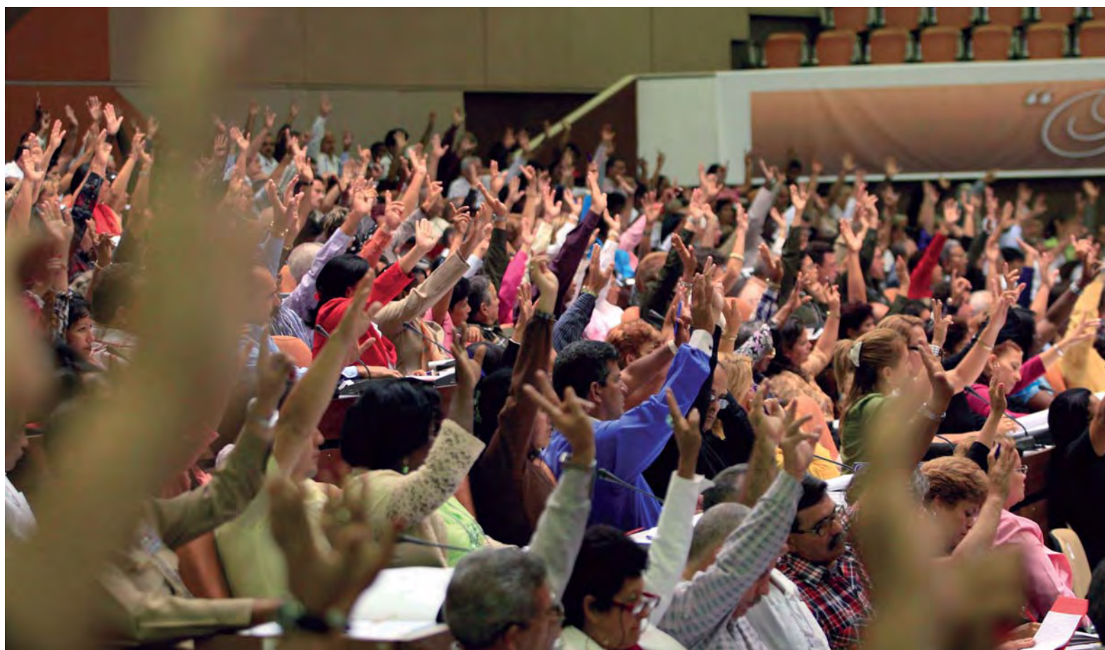
VI Congreso del Partido Comunista de Cuba (PCC) en el Palacio de Convenciones de La Habana en abril de 2011, aprobación de la candidatura al nuevo Comité Central.

El manejo del tiempo y los plazos parece una clave fundamental en la actual realidad cubana. A nivel de calle tanto la mejoría económica como las medidas que se van anunciando se muestran con abierta lentitud y, en general, no consiguen dar la sensación clara de una transformación en positivo de la vida cotidiana, pero la máxima dirección del país insiste en la necesidad de desarrollar el anunciado proceso de cambios sin apresuramientos y tras estudios detallados, alertando del peligro que implica la precipitación. Un dato que parece indicar la importancia que asigna el Gobierno a mantener el máximo consenso social pero que, paralelamente, también pone de manifiesto una variable “imprevista” que ha tomado cuerpo en los últimos tiempos: la fuerte resistencia a todo tipo de cambio que viene mostrando una parte importante del aparato burocrático intermedio, donde la corrupción y un manejo velado del poder administrativo tienden a disuadir seriamente la aplicación de