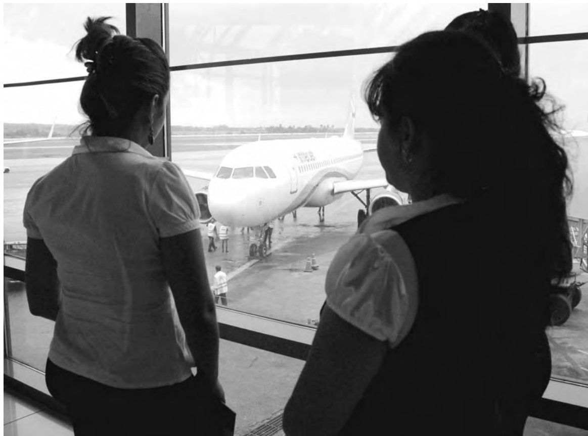
Trabajadoras de la Terminal 3 del aeropuerto Internacional José Martí observan el avión Airbus de la aerolínea mexicana Interjet, de la nueva ruta diaria Ciudad de México—La Habana.

Podemos entonces concluir que, sin desconocer los inconvenientes que acarrea, el envío de remesas da forma a un proceso de integración económica entre Cuba y su emigración, cuyas consecuencias políticas tienden a atenuar diferencias, más que agudizarlas; avanzando en la normalización de las relaciones, incluso en el predominio de la concordia sobre la confrontación, por mucho esfuerzo que hagan los congresistas cubanoamericanos por impedirlo.