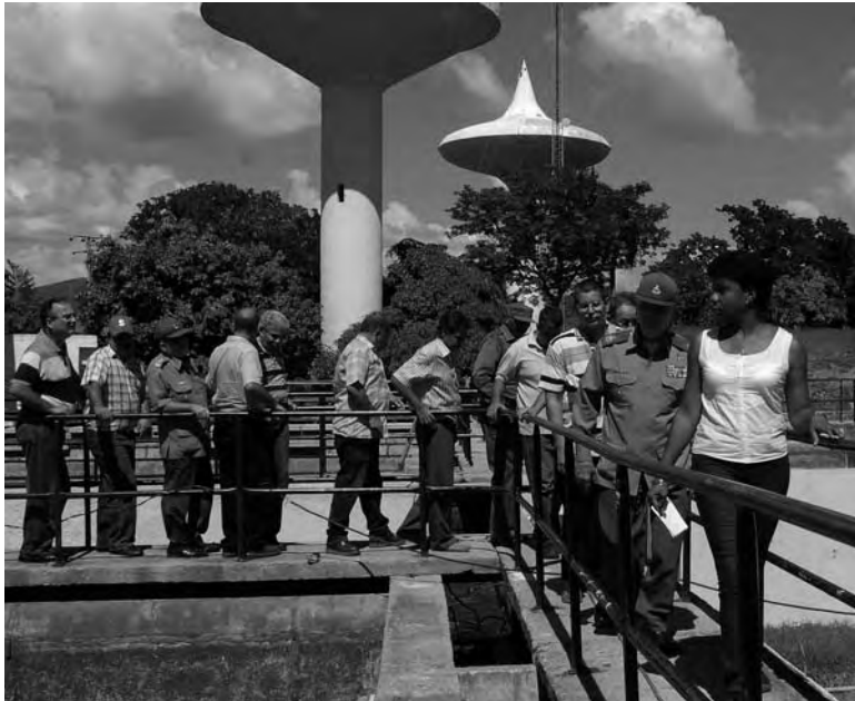
Ramiro Valdés e Inés M a Chanma, jefa de la inversión, inspeccionan las obras del nuevo acueducto de Santiago de Cuba.

Todo esto significó la paralización y posterior atraso de la obra con la consiguiente pérdida de más de 190.000 pesos y la afectación del servicio de suministro de agua