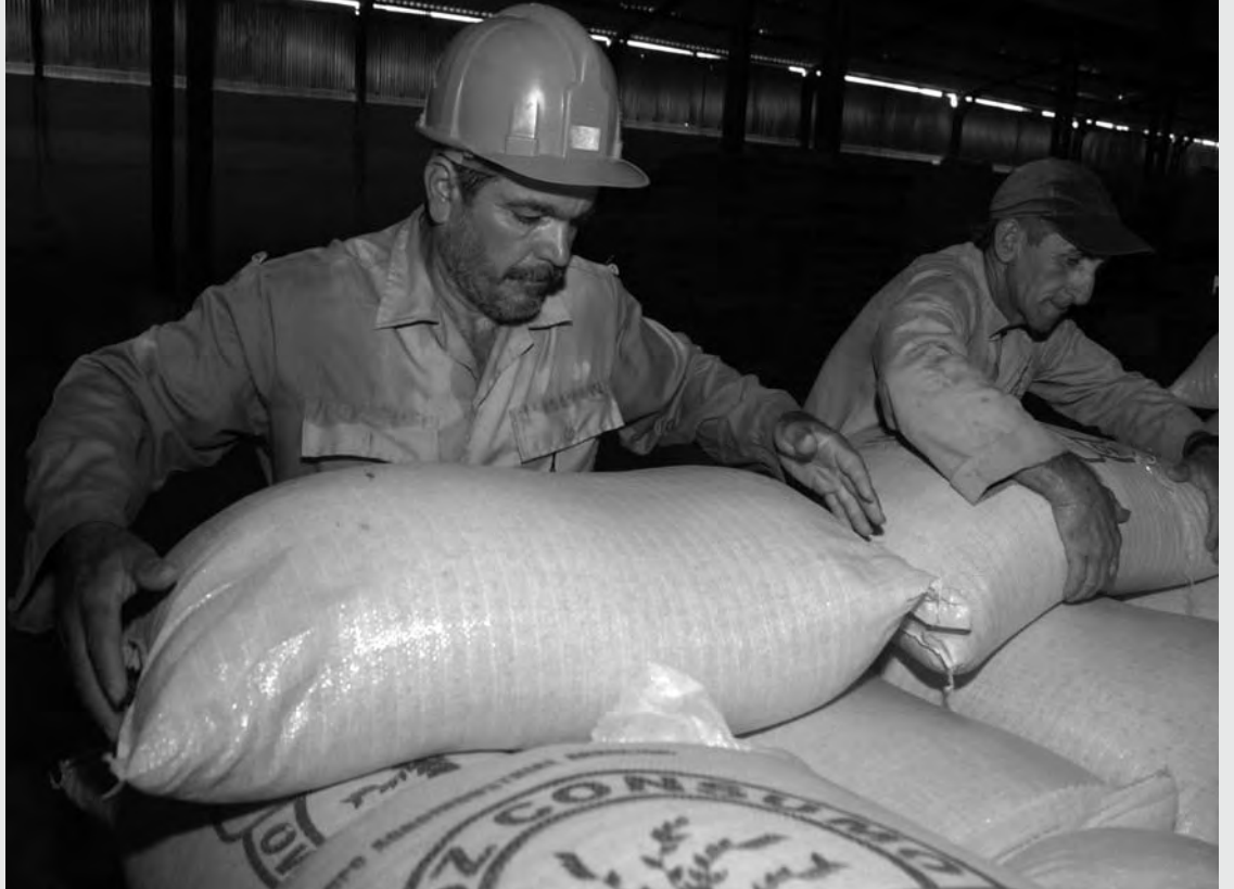
Complejo Agroindustrial Arrocero, municipio Aguada de Pasajeros (Cienfuegos).

En los contextos sociales del siglo XXI y su transición socialista, además de la implementación de los resortes del mercado (cuentapropismo, sistema fiscal y de precios incluido), son cuatro los elementos básicos que a nuestro entender deben garantizarse para que el sistema empresarial estatal socialista cubano logre el autogobierno responsable anhelado y los cito: un fuero legal que lo establezca, lo garantice y lo proteja; que los empresarios puedan y se les permita decidir, poder mandar en pos del alcance de sus objetos sociales y misiones; que los trabajadores de estas entidades puedan retener una parte de las utilidades o resultados finales alcanzados, luego de haber cumplido con un sistema fiscal estimulante y com-