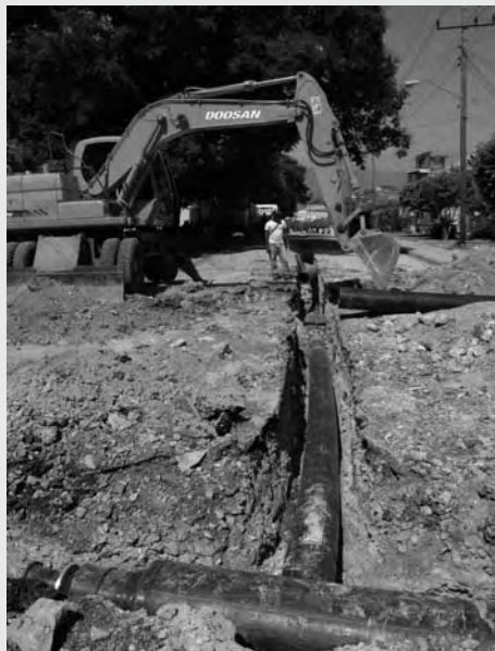
Nueva conductora de agua en la ciudad de Santiago de Cuba.

La Corrupción es un mal, está dicho ya, que puede acabar con la Revolución cubana. Un mal extendido desde el nivel de una carnicería del barrio, un policía, un funcionario de viviendas, un viejito que vende a peso las habitas de nailon que luego faltan en las "shoppings". Manifestaciones visibles que