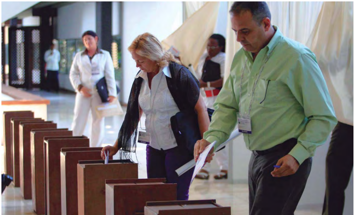
VI Congreso del Partido Comunista de Cuba (PCC), ejerciendo su derecho al voto para elegir al nuevo CCPC.