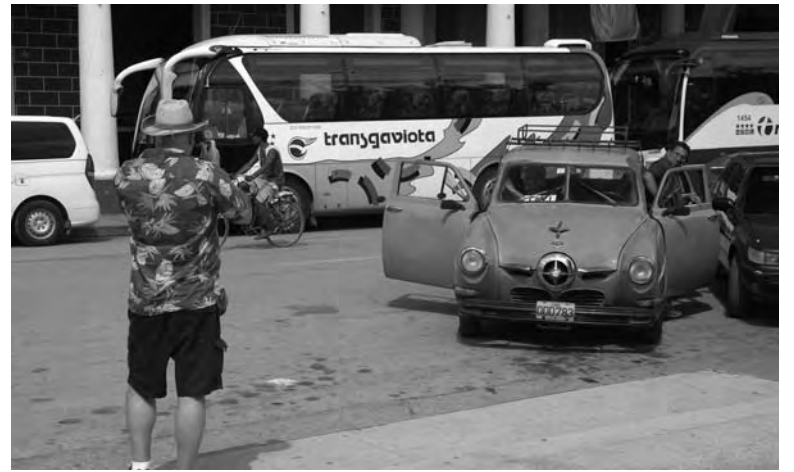
Turista fotografiando un coche en Holguín.

Hasta ahora, los cubanos solo podían comprar y vender los mode-