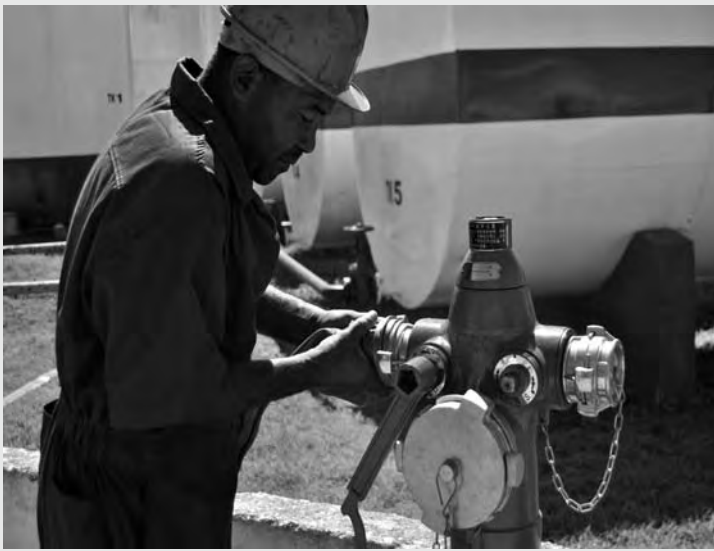
Trabajador de Cuba Petróleos en simulacro de incendio, ejercicio Meteoro 2011 en Bayamo (Granma).

Entre los aportes más significativos a esta actividad destaca el trabajo de los parques eólicos, los cuales sustituyeron el empleo de unas 1.700 toneladas de combustible.