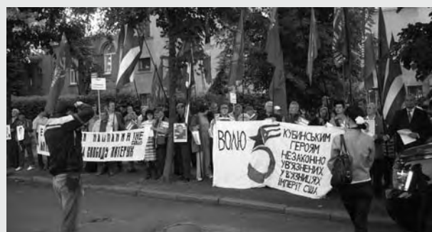
En Ucrania se recogieron 86.000 firmas por Los Cinco Imagen de concentración frente a Embajada de EEUU en Kiev, 12 de septiembre