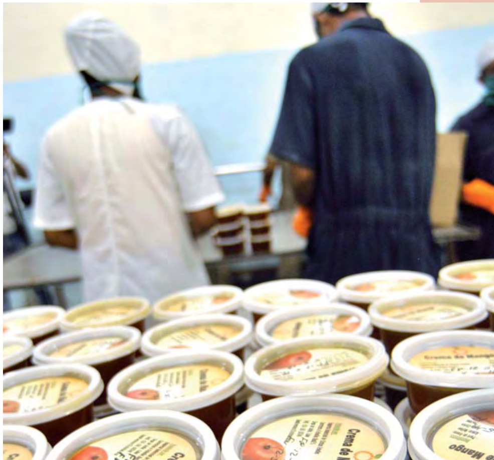
Elaboración de minidosis y pots de cremas de frutas, Empresa Industrial de Cítricos en Ciego de Ávila.

ciudadanía que no está dispuesta a dejarse a arrastrar hacia una “salida” traumática, muy alejada de sus preocupaciones reales.