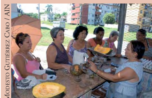
Mujeres en un mercado de productos agrícolas en la ciudad de Cienfuegos.

Esta derrota política de la Unión Europea ante Cuba no es asimilada aún por los medios hegemónicos europeos, particularmente por los españoles, que tratan de ocultar lo evidente: que la Unión Europea, viendo cómo se le escapan a sus empresas las nuevas oportunidades de inversión que ofrece la Isla, ha doblado la rodilla ante Cuba. Tal como lo hizo la OEA en 2009, y tal como lo hará, finalmente, el Gobierno de EEUU.