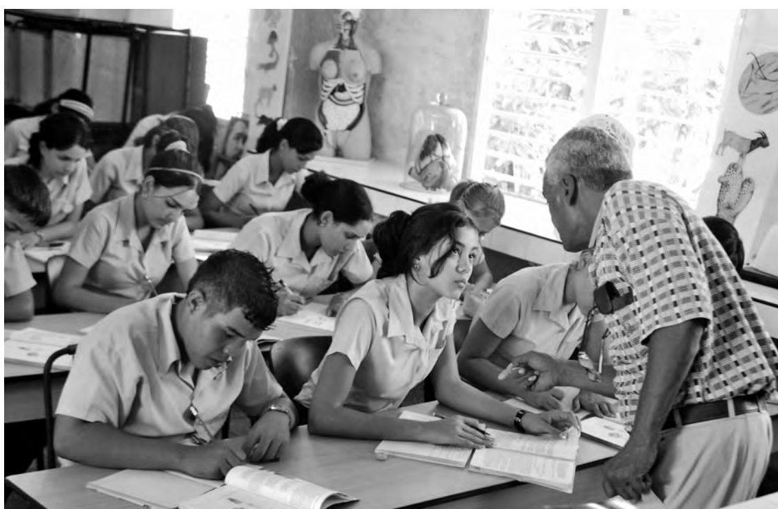
Instituto Preuniversitario de Ciencias Exacta (IPVCE) "Luis Urquiza Jorge" (Las Tunas).