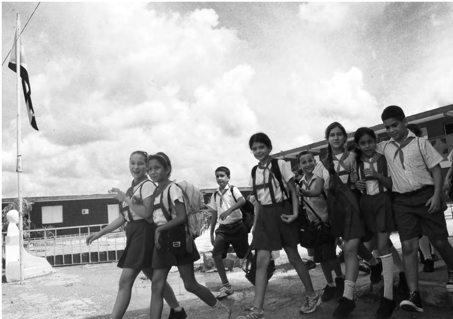
Estudiantes del grado quinto en la escuela primaria Farabundo Martí, de Ciego de Ávila, Cuba.

Es muy significativo que, paradójicamente, medio siglo después de que Cuba fuera expulsada de la OEA, la mayoría de países de América Latina y del Caribe se reunieran precisamente en La Habana, Cuba, como parte de la CELAC (que incluye prácticamente a los mismos países que constituyen la OEA, excepto EEUU y Canadá). A esta reunión fueron invitados José Miguel Insulza, secretario general de la OEA, como observador, y el secretario general de Naciones