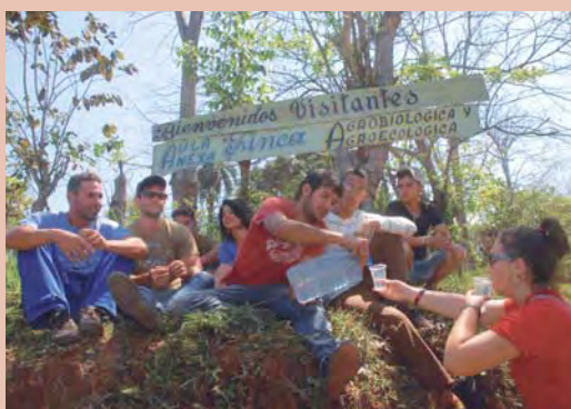
Finca experimental de plantas medicinales "Gallego Otero", en el municipio de Cumanayagua, Cienfuegos.

Lisandra Fariñas Acosta / Granma.- La Empresa Minorista de Medicamentos del Oeste de La Habana, DISMED, es una de las instituciones encargadas de planificar, producir y distribuir medicamentos naturales en las farmacias, policlínicos, hospitales y otras instituciones de salud. Las farmacias de toda Cuba cuentan con personal universitario adiestrado para la producción y dispensación de medicamentos naturales, y la medicina natural y tradicional está en la primera línea de tratamiento de algunas enfermedades. Los productos más demandados por la población son el jarabe de aloe, el de orégano, el imefasma y los elaborados a partir del ajo.