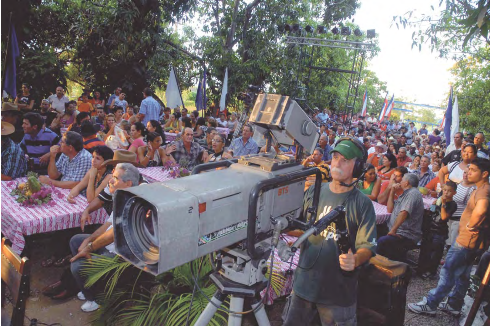
Transmisión del programa "Palmas y Cañas" de la televisión cubana, desde Cienfuegos.