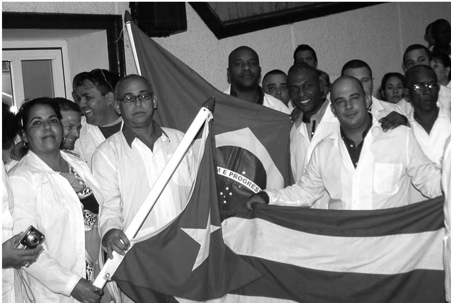
Médicos cooperantes de Ciego de Ávila en acto de despedida celebrado en el teatro del Comité Provincial del Partido.

Las campañas mediáticas contra la presencia médica cubana no son de ahora. En Venezuela, por ejemplo, los medios acusaban a los cooperantes cubanos de ser “agentes” o “espías”. En Brasil, el mensaje central de la actual campaña mediática es que son “esclavos” del Gobierno cubano, al destinar este a otros fines sociales en la Isla una parte de lo ingresado. Es un contraste radical de conceptos ideológicos: el que defiende un estado socialista en un país pobre y bloqueado como Cuba que, gracias a la formación de miles de profesionales, sostiene su sistema de salud con ingresos generados en el exterior; y, por otro lado, el que