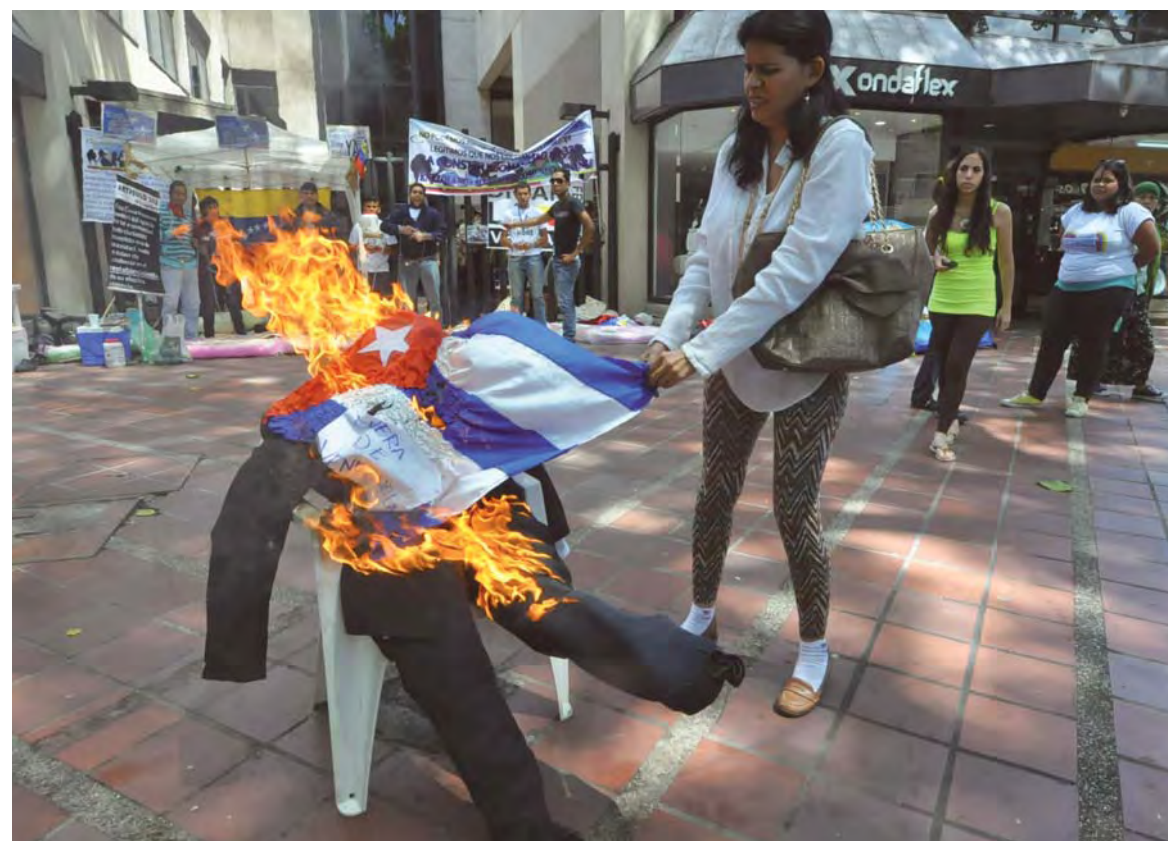
Opositora venezolana quema una bandera de Cuba.

do no es de libertades, sino económico: quienes han puesto el grito en el cielo han sido precisamente los grandes empresarios mediáticos, que se han visto amenazados mediante las nuevas legislaciones que buscan poner límites a los monopolios informativos.