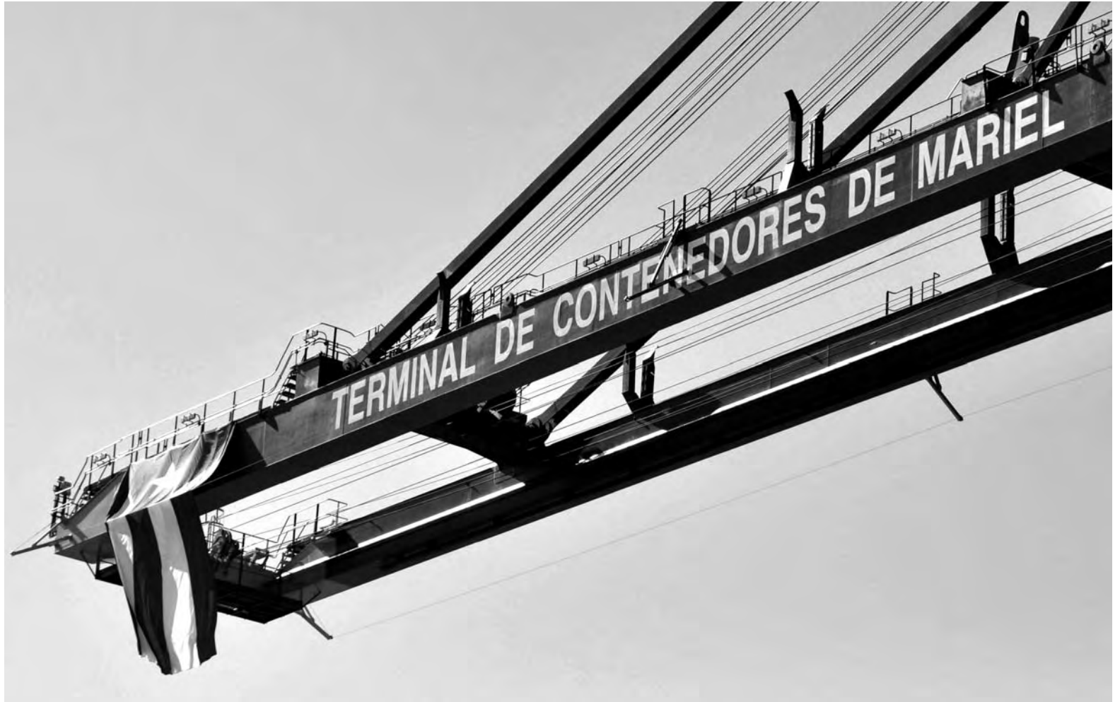
Día de la inauguración de la Zona Especial de Desarrollo de Mariel (provincia de Artemisa), el 27 de enero de 2014.

involucrada en la construcción de la terminal portuaria en Mariel, ha estado vinculada desde 2012 en un contrato de administración productiva para la fabricación de azúcar en el central 5 de Septiembre de Cienfuegos, con el objetivo de incrementar en más de cinco veces su producción en unos 10 años, con un aporte de inversión valorado en 200 millones de dólares. Igualmente, la entidad ha venido negociando con Cuba para modernizar un grupo de aeropuertos del país.