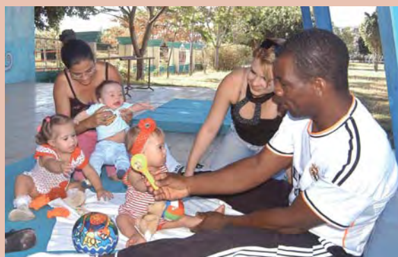
OSVALDO GUTIÉRREZ GÓMEZ / AIN

Iris de Armas Padrino / AIN.- El Programa Cubano de Rehabilitación, del Ministerio de Salud Pública (MINSAP), en los 12 años de creado, garantiza la asistencia del ciento por ciento de los pacientes. Cuba posee 520 servicios de rehabilitación integral distribuidos en hospitales, policlínicos, hogares de ancianos y centros de educación psicopedagógica para impedidos físicos. Con más de 20.000 rehabilitados, la nación antillana presta, además, servicios de rehabilitación en 38 países.