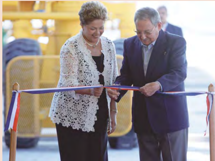
Presidentes de Cuba y de Brasil, Raúl Castro y Dilma Rousseff, en la inauguración de la primera fase de la ZEDM.

“Por primera vez en la historia reciente un candidato del Partido Republicano a la gobernación del estado de la Florida se ha pronunciado por la normalización de las relaciones entre su país y Cuba.”