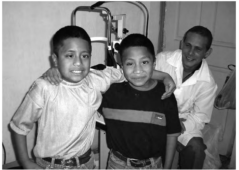
Los primeros doctores cubanos en Medicina llegaron a Guatemala en noviembre de 1998, tras el paso del devastador huracán Mitch.

Gracias al programa Operación Milagro, señala el reporte, se intervinieron 125.467 casos por diferentes patologías oftalmológicas. Esa misión es un proyecto humanitario que comenzó en 2004 y fue impulsado por los gobiernos de Cuba y Venezuela con el objetivo de devolver la visión a ciudadanos de escasos recursos que sufren distintas afecciones oculares.