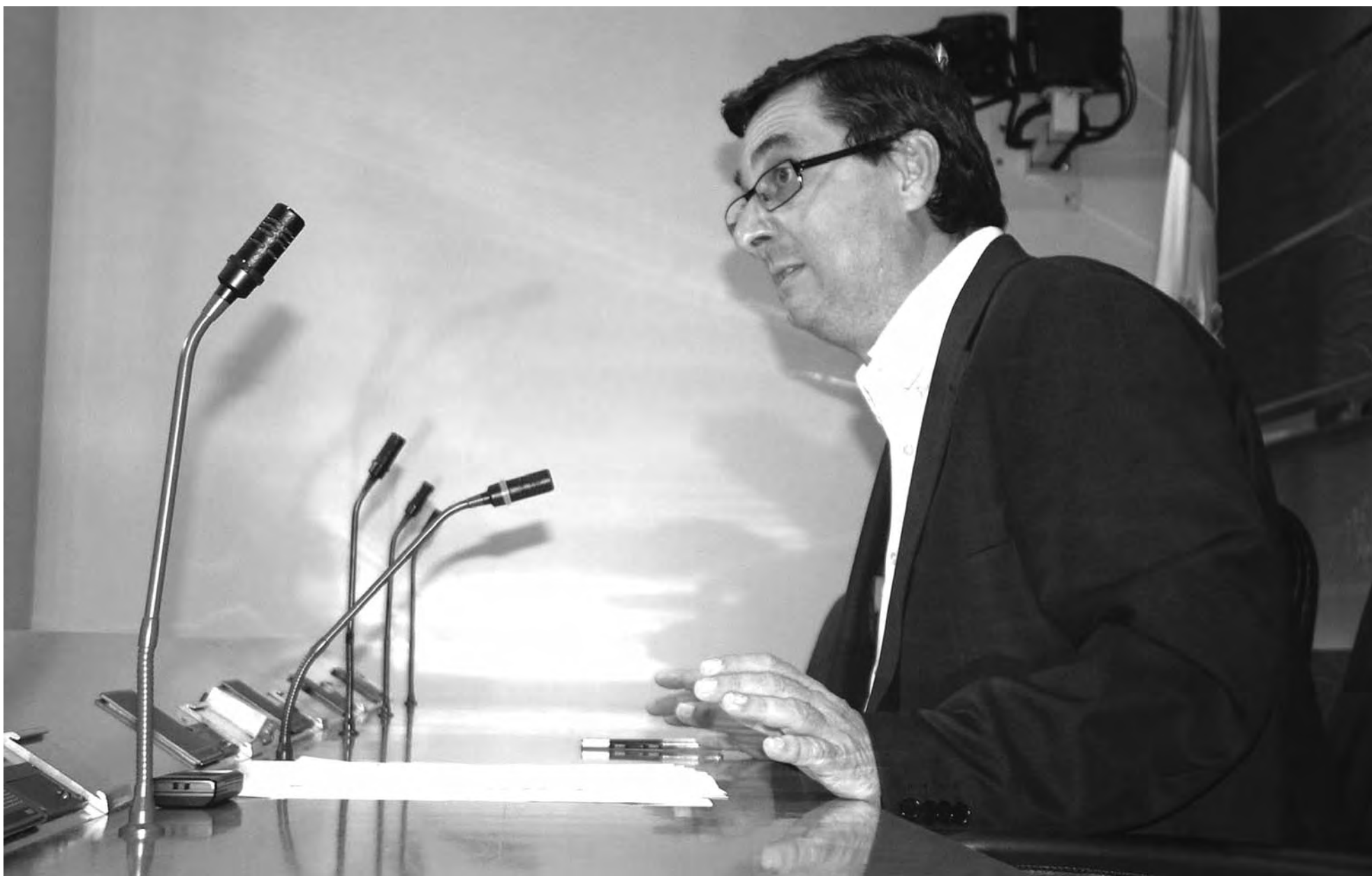
José Luis Centella, diputado español