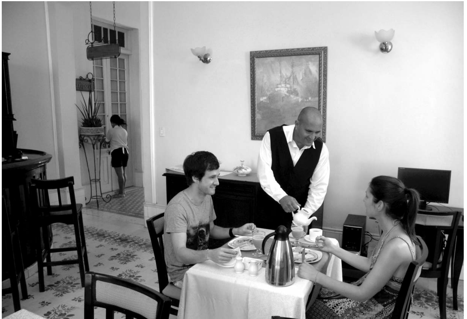
Complejo hotelero La Unión—Palacio Azul del Grupo Gran Caribe, del Ministerio del Turismo en Cienfuegos.

No hizo falta estadounidenses para la crecida, pero sí los Estados Unidos. Las visitas de otras nacionalidades se dispararon después de anunciar los presidentes Raúl Castro y Barack Obama el 17 de diciembre de 2014 el inicio de conversaciones para normalizar relaciones. Curiosidad por ver las ciudades y playas antes de que lleguen los