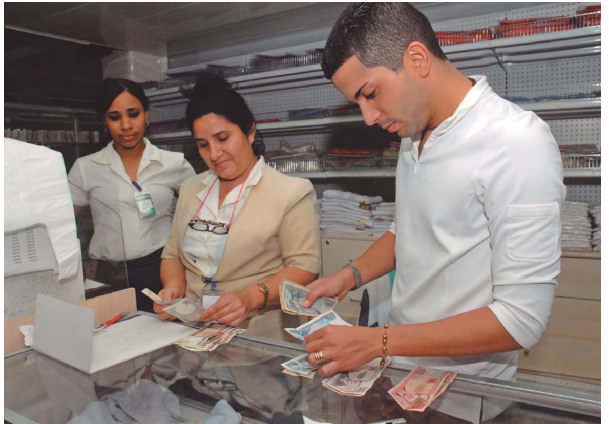
Dependientes de una tienda de la ciudad de Bayamo (provincia de Granma), de las que operaba solo en pesos convertibles, realizan el cuadro de caja al final del día, también en moneda nacional.

A un año del restablecimiento de relaciones entre Cuba y EEUU, y a pesar de los avances diplomáticos, pocos han sido los pasos dados por la administración Obama para levantar su escollo fundamental: el bloqueo económico a la Isla. Entre las tímidas medidas aprobadas, cabe señalar: la ampliación de los perfiles de personas de EEUU que pueden realizar viajes no turísticos a Cuba, las licencias a compañías norteamericanas de telecomunicaciones para llegar a acuerdos con la empresa estatal cubana ETECSA, o el restablecimiento del servicio postal directo. Y poco más. Estos pequeños pasos, sin embargo, han ido acompañados de importantes efectos indirectos.