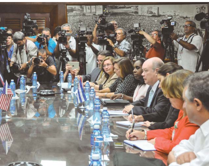
no y estadounidense, durante la reunión sobre las posibilidades de impulsar el comercio bilateral, octubre de 2015.

En el ámbito bilateral y nacional, la crisis de migrantes cubanos en Centroamérica marcó también el fin de 2015 y determina uno de los temas relevantes pendientes, tanto en el caso presente como en la proyección al futuro. Para Cuba, 2016 será otro año de oportunidades y retos, clave para aprovechar el espacio que ofrece el actual momentum , el contexto, en beneficio de sus intereses como nación.