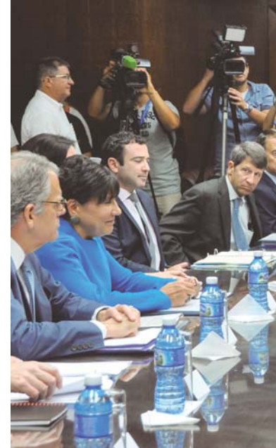
Reunión de altos cargos de los gobiernos cubano y estadounidense en la sede del MINVEX, en La Habana, el 7 de octubre de 2015.

En su lista, «Foreign Policy» resaltó entre los 100 pensadores más influyente del planeta al Papa Francis-