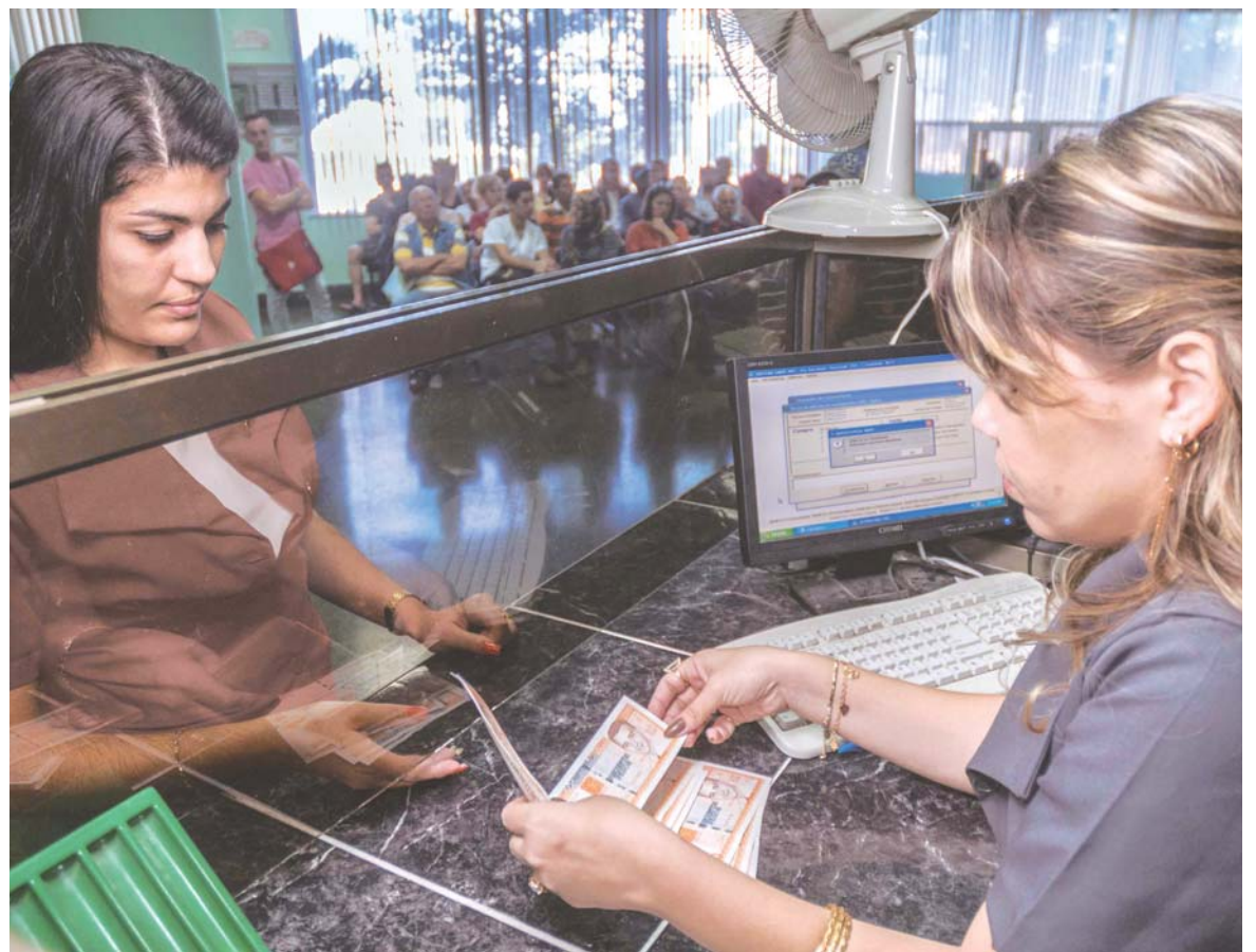
Cajera del Banco Metropolitano de 23 y J, en La Habana, entrega nuevos billetes.

donará jamás la lección de resistencia y valor que ha protagonizado nuestra patria desde 1959 y que está en la base real y objetiva de los cambios que comenzaron a producirse el 17 de diciembre de 2014. Es una lección que no tenemos derecho a olvidar.