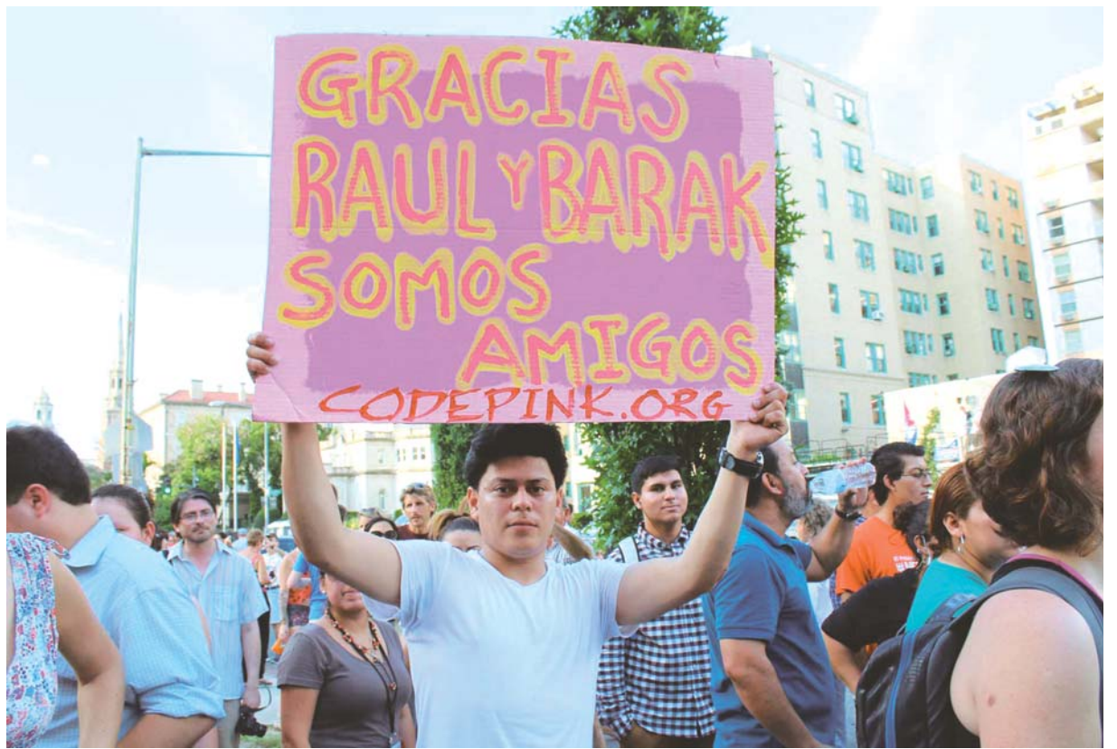
Público asistente a la reapertura de la embajada cubana en la capital estadounidense.

En diciembre el Club de París condonó 8.500 millones de dólares a Cuba. El grupo destacó que es un paso importante para que el país se rein-