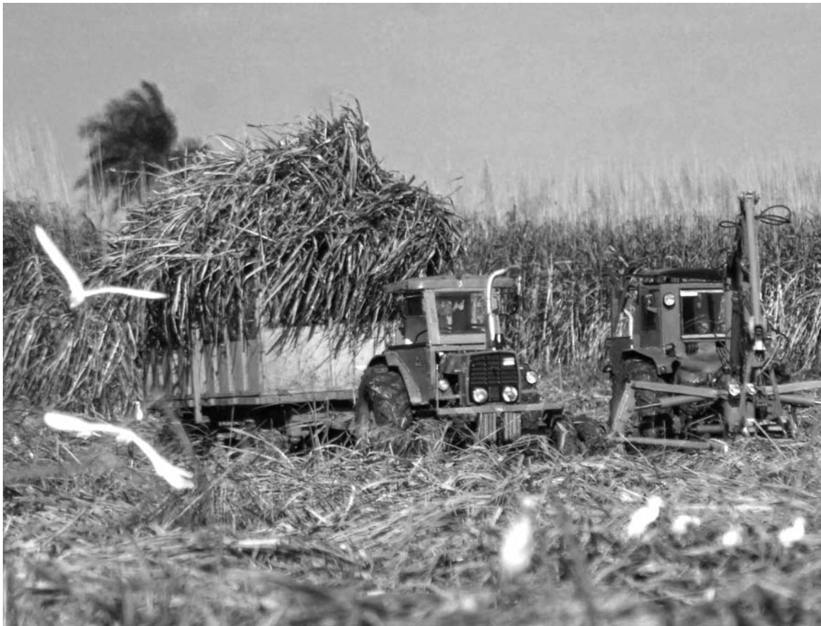
Cooperativa de Producción Agropecuaria (CPA) Camilo Cienfuegos, de Meneses.

Y es que los tractores producidos por CleBer en el Mariel no estarían dirigidos al sector estatal sino a pequeños agricultores individuales y