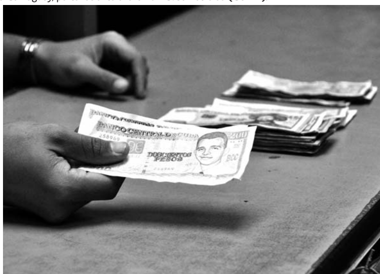
Nuevos billetes de 200, 500 y 1000 pesos en moneda nacional (CUP), en circulación desde el 3 de febrero de 2015.

La experiencia de países de Europa Oriental que ingresaron al FMI en su etapa socialista, como fue el caso de Yugoslavia, Hungría y Rumanía, mostró desde entonces las nefastas consecuencias de esa decisión