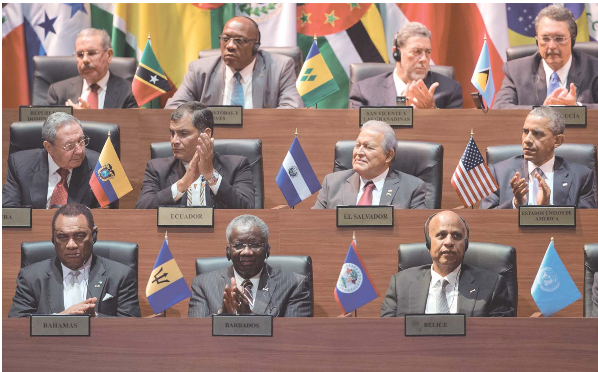
Sesión de inauguración de la Cumbre de las Américas, celebrada en Ciudad de Panamá, el 10 de abril de 2015.