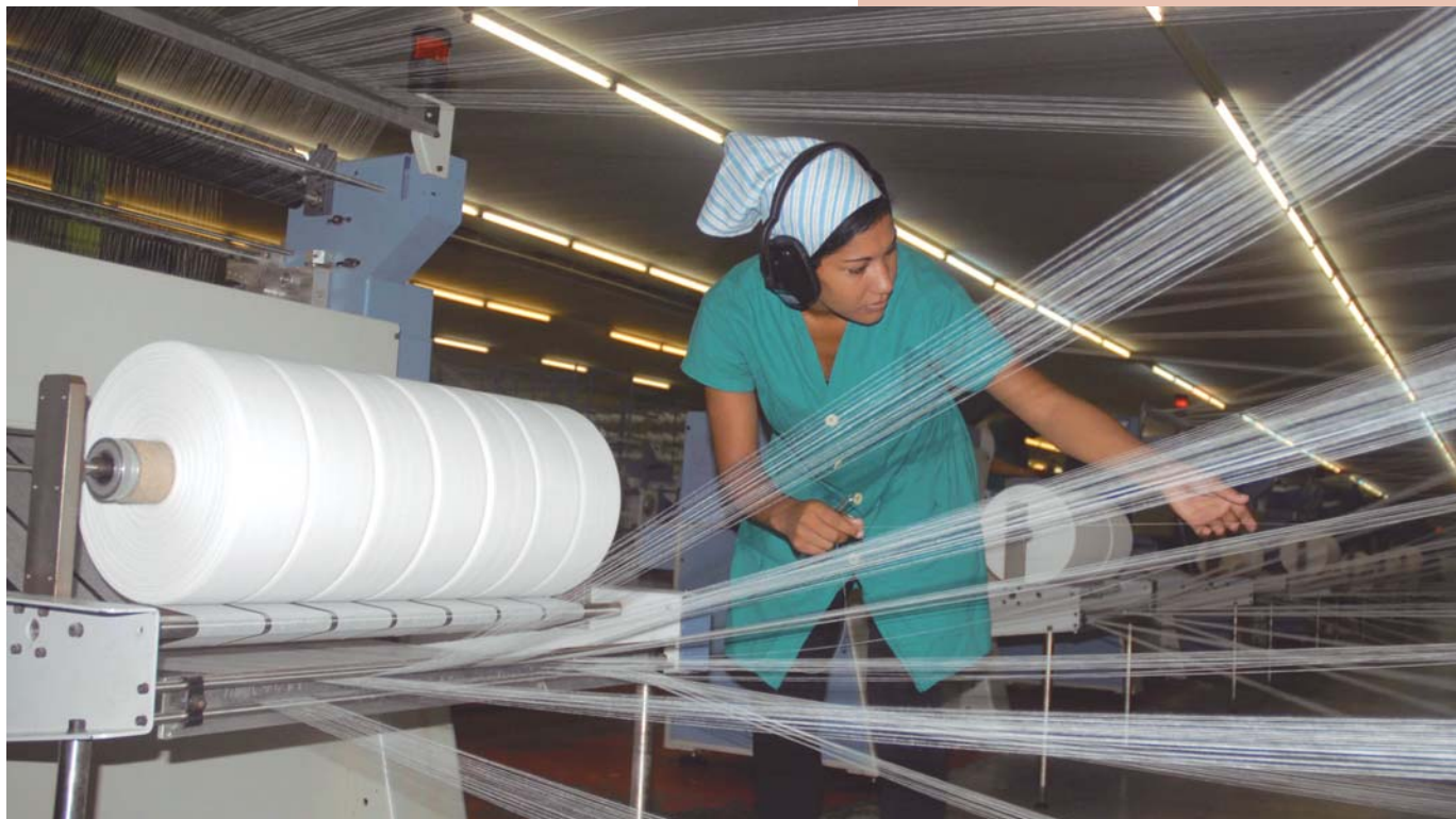
Taller de gasas quirúrgicas, en la unidad básica textil Desembarco del Granma, en Santa Clara.

Una transición al capitalismo en Cuba supondría no solo reimplantar la explotación del hombre por el hombre como base de la reproducción del sistema, sino que estaría sujeta a la represalia de la mayor potencia capitalista del mundo, que no perdonará jamás la lección de resistencia y valor que ha protagonizado nuestra patria