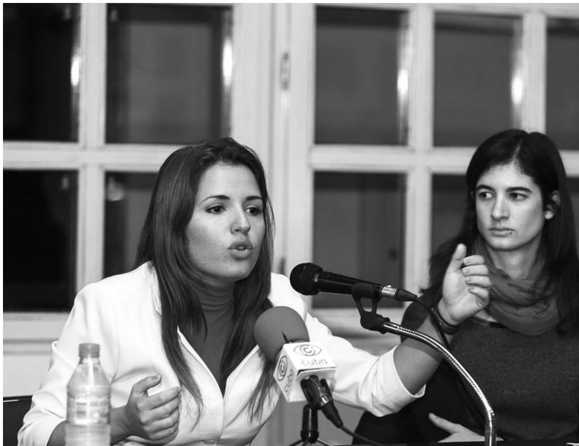
Otro momento de la charla en La Bolsa.

“TeleSUR en América Latina, es la propuesta audiovisual y multimedial más importante que hay desde un lenguaje y contenidos emancipatorios. Yo creo que lo más importante de teleSUR, su huella, es ayudar a crear un ciudadano preparado, un ciudadano emancipado, capaz de juzgar entre las diferentes fuentes de información”