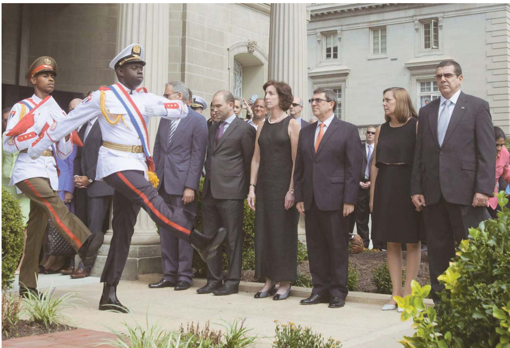
Acto de inauguración de la embajada de Ciuba, en Washington D.C., Estados Unidos, el 20 de julio de 2015.

En los 12 meses transcurridos desde el 17 de diciembre de 2014, Cuba y EEUU restablecieron relaciones diplomáticas: hoy hay embajadas y banderas de uno y otro país izadas en Washington y La Habana. Los dos gobiernos se sentaron a hablar de temas que van de los derechos humanos a las telecomunicaciones o las reclamaciones legales relacionadas con compensaciones por propiedades nacionalizadas y por daños económicos del bloqueo.