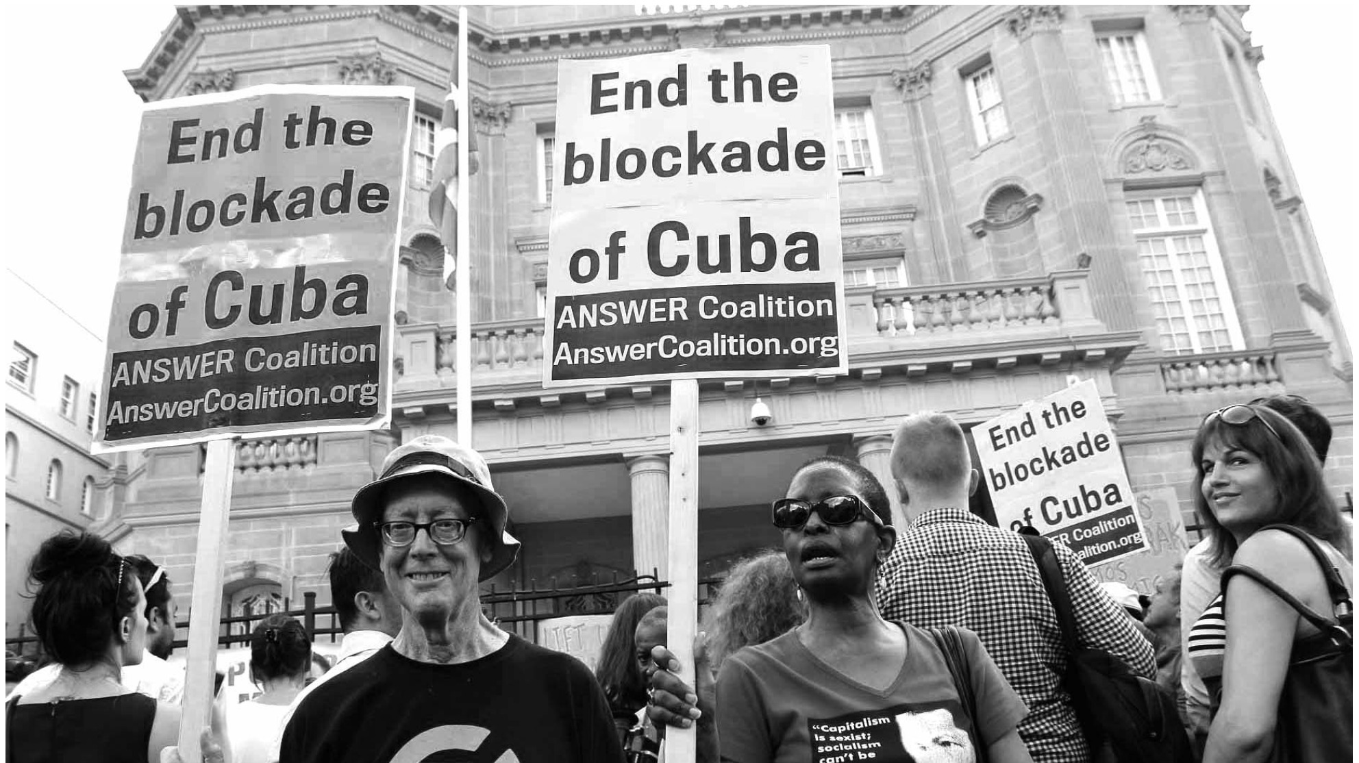
Público asistente a la reapertura de la embajada cubana en la capital estadounidense.