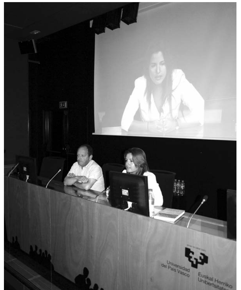
Charla ofrecida en la Universidad del País Vasco (EHU—UPV).

teleSUR empezó siendo, alguien dijo, "una CNN en español". Pero CNN esta en Atlanta y está pensada desde los poderes fácticos que están en EEUU. teleSUR venía a ser no solamente un medio que ofreciera visiones de América Latina mas realistas, más profundas y menos estereotipadas. Creo que es mas profundo que eso. Los noticieros y los contenidos periodísticos son muy efímeros. Yo creo que lo