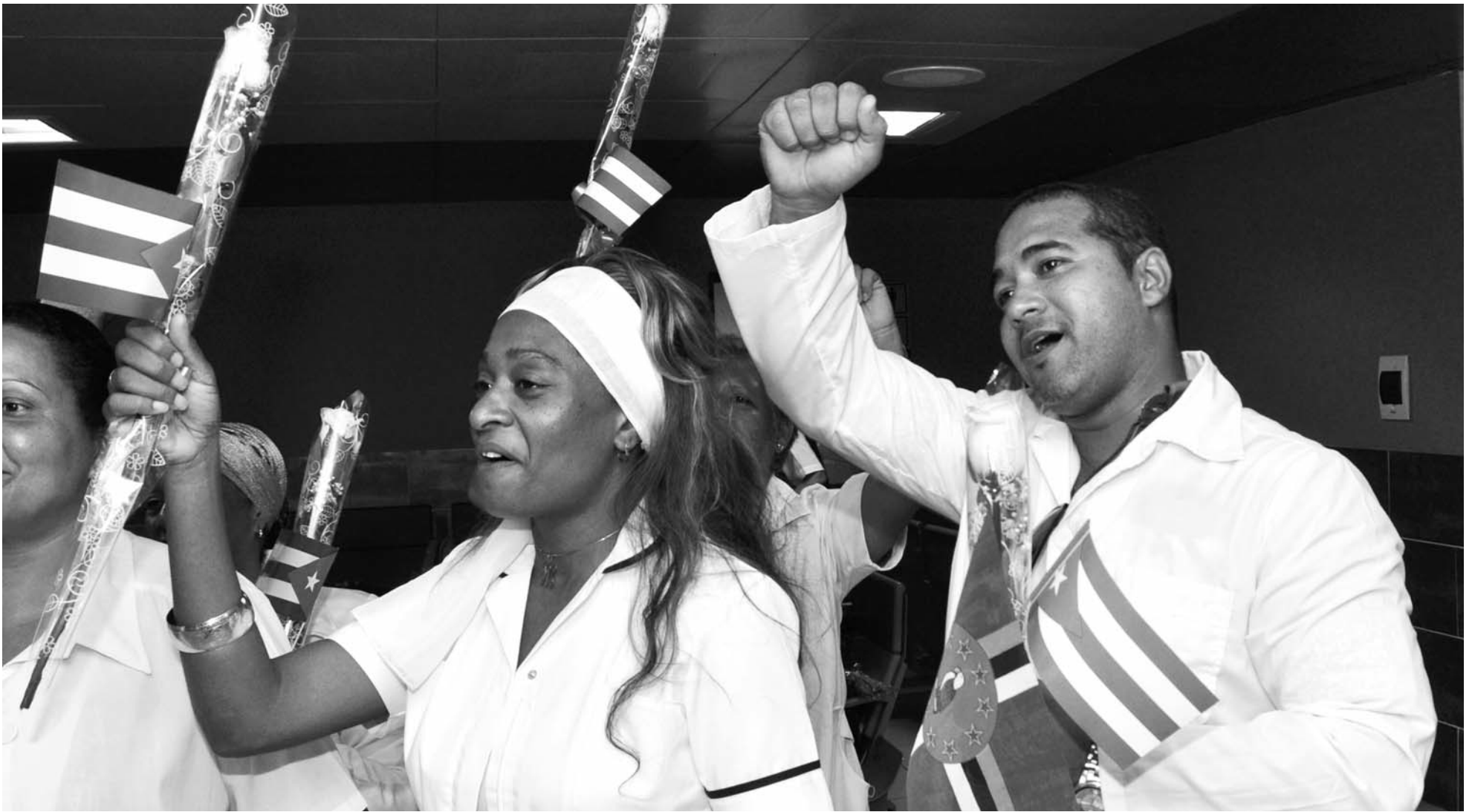
Personal médico y de enfermería, ingenieros de la construcción y de la Unión Eléctrica, a su regreso de la misión en Dominica por la tormenta tropical Erika.