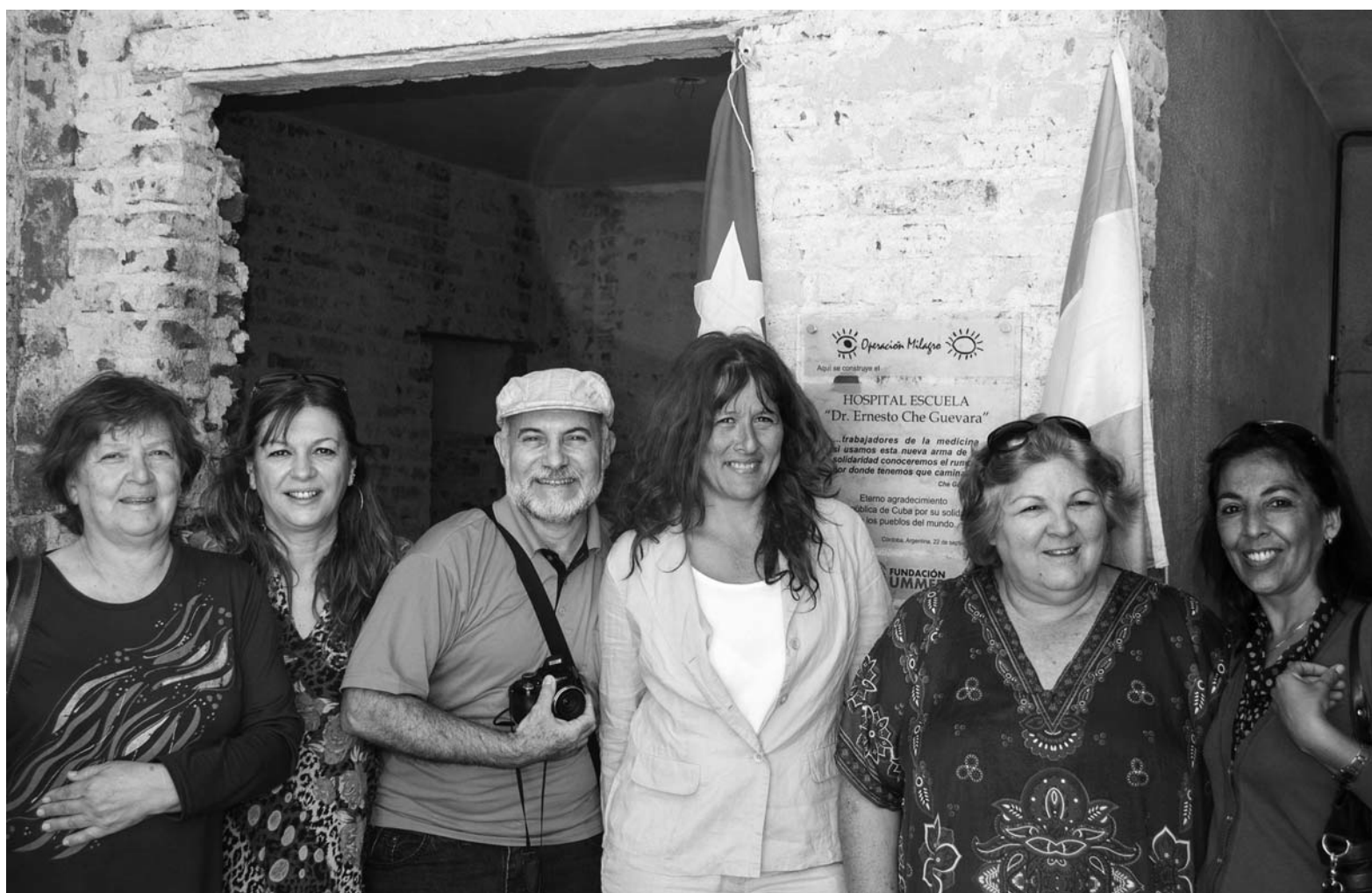
Inauguración del primer hospital-escuela de oftalmología Dr. Ernesto Che Guevara, en el barrio San Martín de la ciudad de Córdoba.

- Con la campaña "Para volver a verte, súmate Che" pretendemos que organizaciones sociales, compañeros y compañeras y diferentes países e instituciones se sumen donando dinero o materiales para construir tres pisos que faltarían para este centro de estudios. ¿Por qué? Porque ya inauguramos el hospital y lo vamos a hacer escuela, pero no estaríamos en condiciones de traer médicos y médicas, enfermeros y enfermeras del interior del país, que necesitan un alojamiento. Un médi-