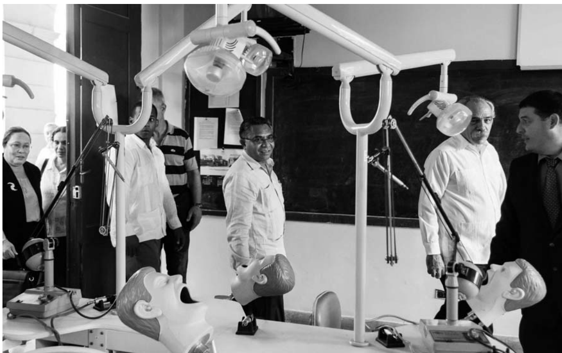
Rui María de Araujo en el laboratorio estomatológico del Instituto de Ciencias Básicas y Preclínicas Victoria de Girón, como parte de su visita oficial en La Habana.

tán unidos”, y expresó su regocijo por la liberación de Los Cinco Héroes cubanos, hace más de un año. El Vicepresidente sudafricano destacó la histórica contribución de Cuba al derrocamiento del apartheid y la independencia de Namibia.