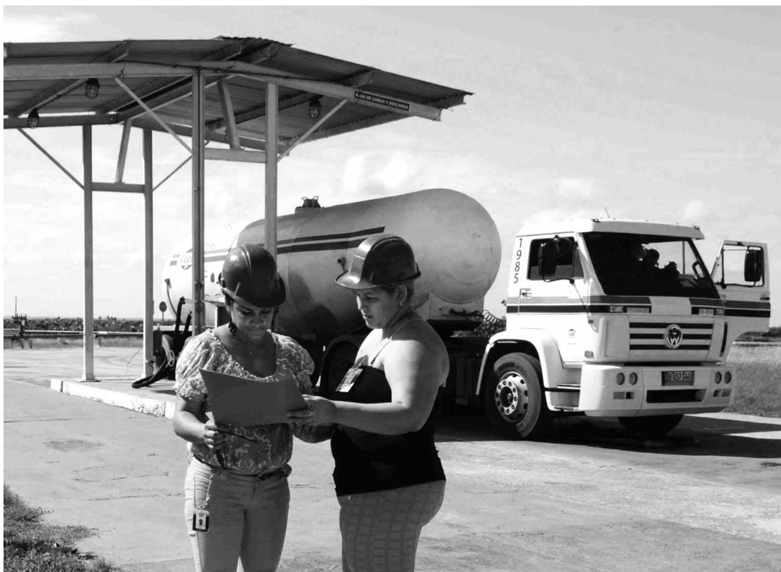
Empresa Comercializadora de Combustibles de Camagüey, perteneciente a la Unión Cuba Petróleo (CUPET).

Si los hechos respaldaran realmente el papel desempeñado por el FMI a lo largo de su historia, no sería tan cuestionada la definición que de sí misma da esta organización, creada según los acuerdos de la Conferencia de Bretton Woods