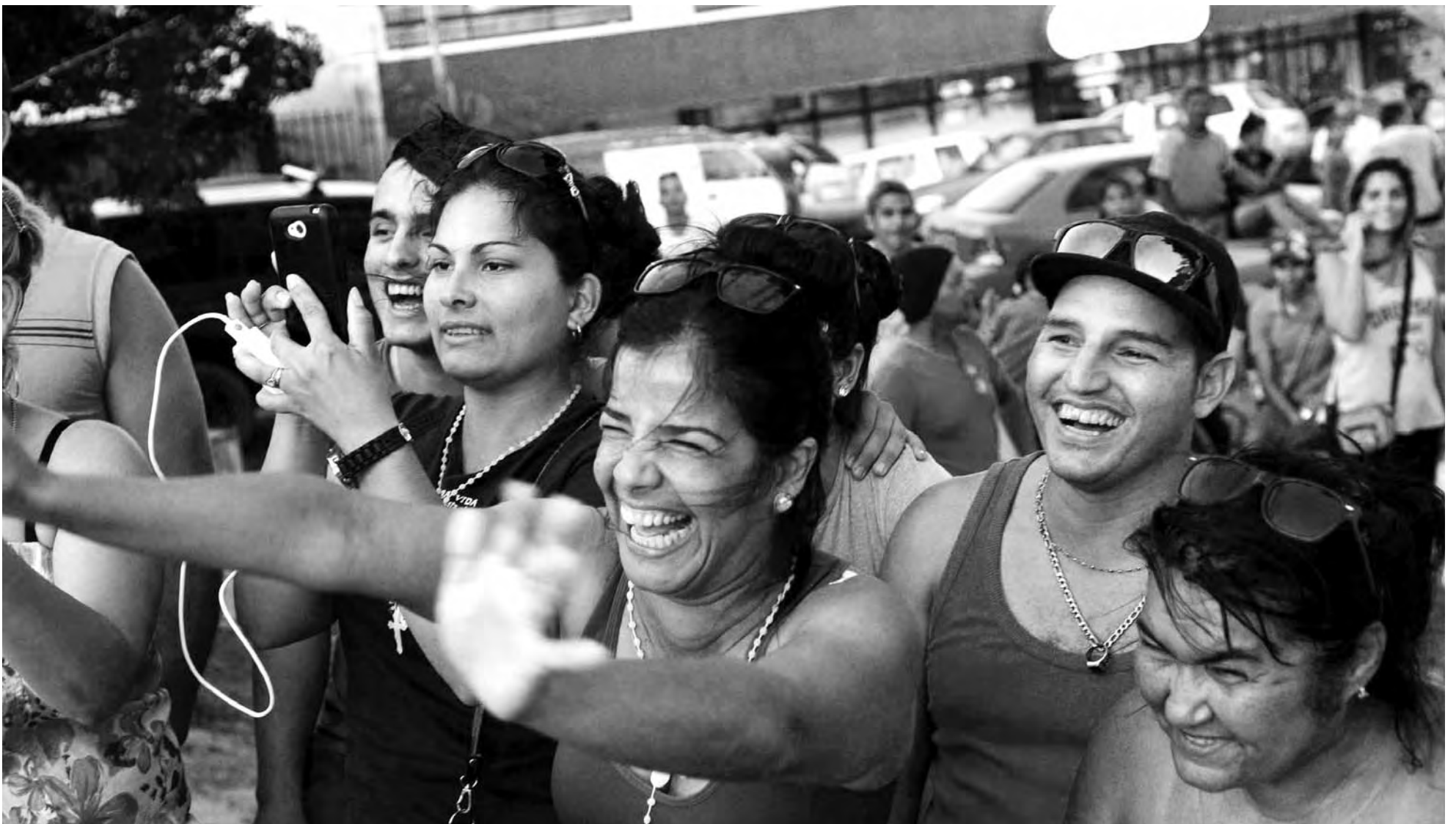
Migrantes de Cuba en el parque la Cruz, Guanacaste (Costa Rica).