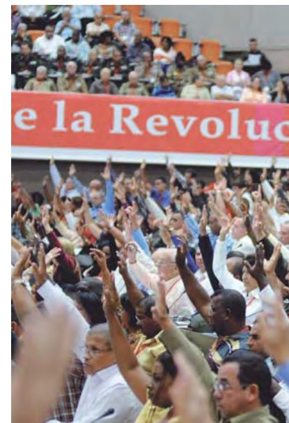
Votación a mano alzada de la resolución sobre el Informe Central del Partido Comunista de Cuba, en sesión plenaria.

Límites al mandato. Raúl Castro reiteró que dejará la jefatura de Estado y de gobierno en 2018. Ratificó su propuesta de fijar un máximo de dos