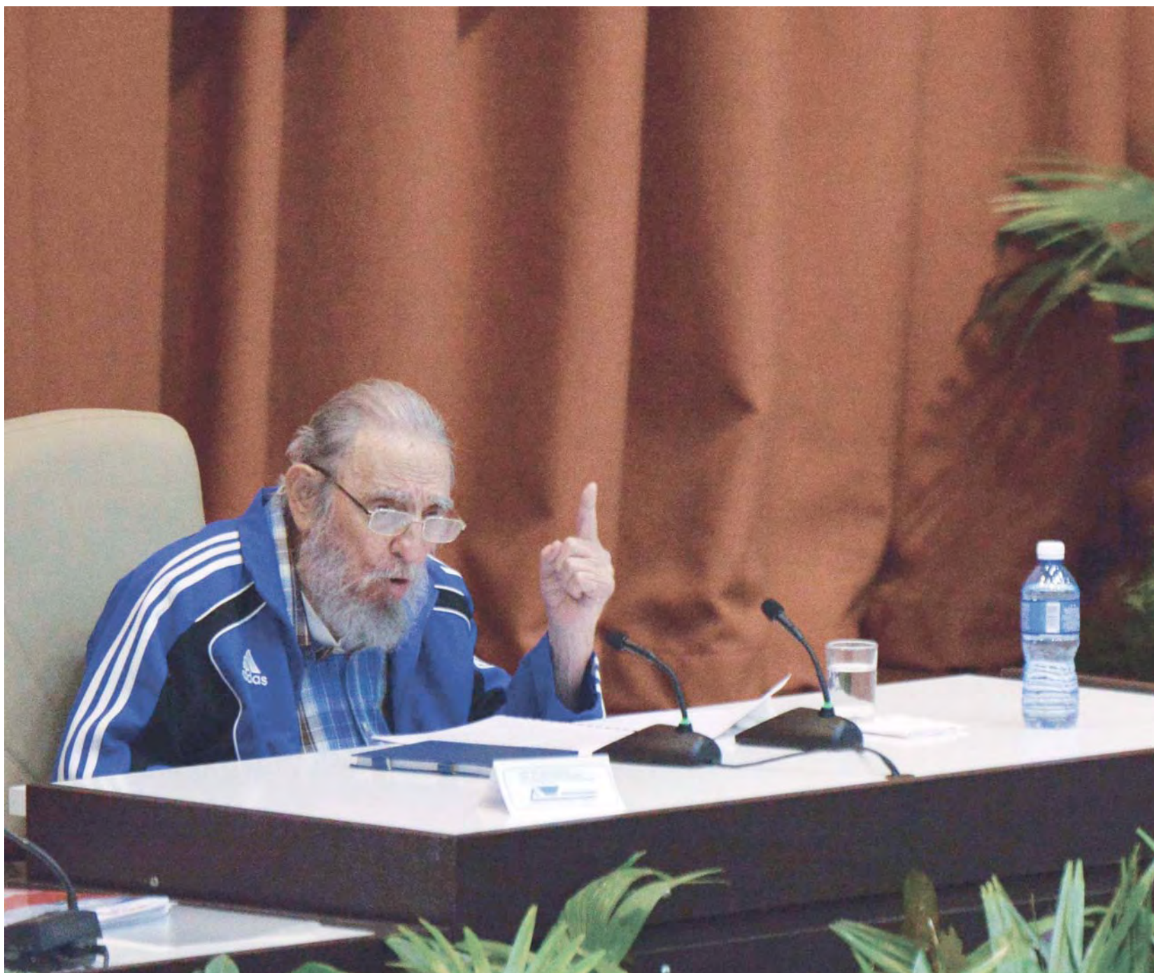
Fidel Castro Ruz durante su intervención en la sesión final del VII Congreso del Partido Comunista de Cuba, en el Palacio de las Convenciones de La Habana.

Errores del proceso de transformación. Raúl Castro identificó la “mentalidad obsoleta” de quienes aún miran hacia arriba esperando órdenes y la “nostalgia” de la época de acuerdos con la URSS como el principal obstáculo en el proceso de cambio, que conlleva inercia y burocratismo. Además, señaló otras deficiencias, como la falta de preparación, exigen-