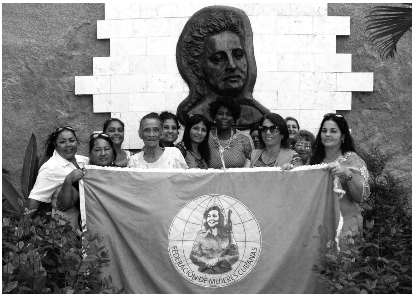
Un grupo de federadas camagüeyanas rinden tributo a Amalia Simoni, en el aniversario 55 de la Federación de Mujeres Cubanas.

Ha crecido mucho la incorporación al trabajo de las mujeres en el sector cooperativo campesino, en aspectos tan importantes como la producción de alimentos, el control de los recursos, aumento de la disciplina y la organización del trabajo en las áreas en las que laboran, dedicándose de forma muy importante al fomento de cultivos varios, cría de ganado mayor y menor para la producción de leche y carne, etc. según información de la Asociación