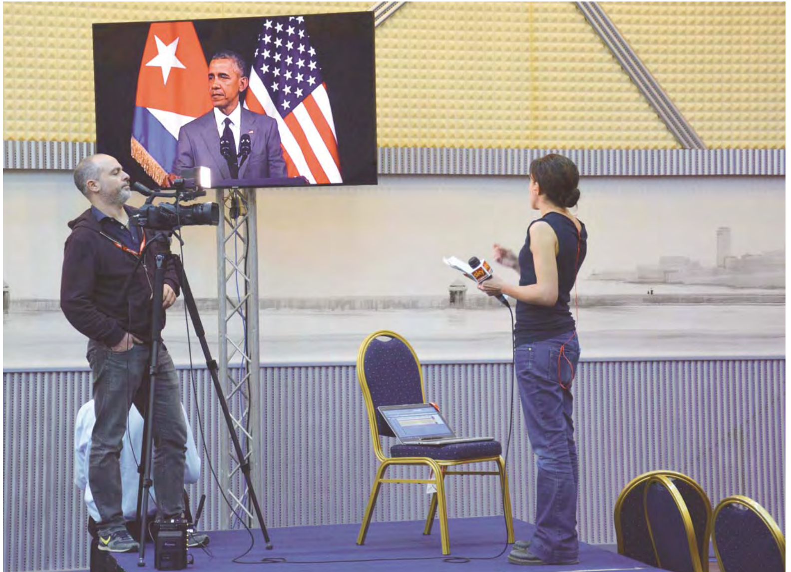
Periodistas acreditados en la visita del presidente Barack Obama, siguen su discurso desde la sala de prensa del hotel Habana Libre.

5) Política de cambio de régimen, ampliada. Si bien se mantiene la política de legitimar a la contrar-