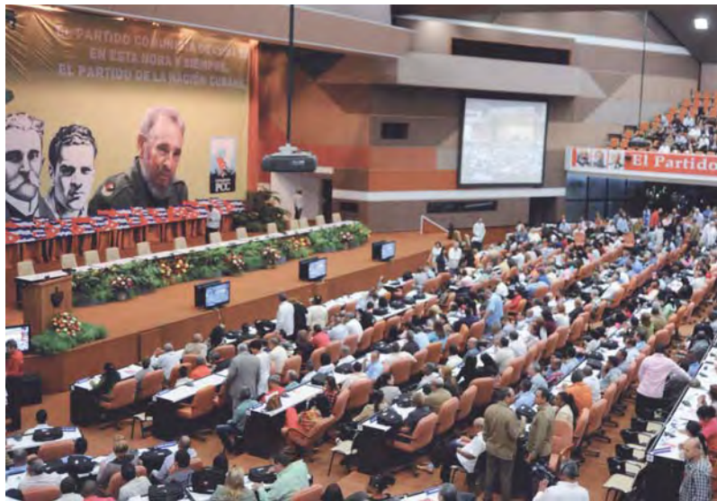
Vista del plenario antes del inicio.

En la propuesta se definen “los ejes estratégicos como pilares y fuerzas motrices de la estrategia de desarrollo del país, para un gobierno eficaz y socialista y la integración social; la transformación productiva e inserción internacional; el desarrollo de infraestructura, potencial humano, la ciencia, la tecnología, la innovación, los recursos naturales y el medio