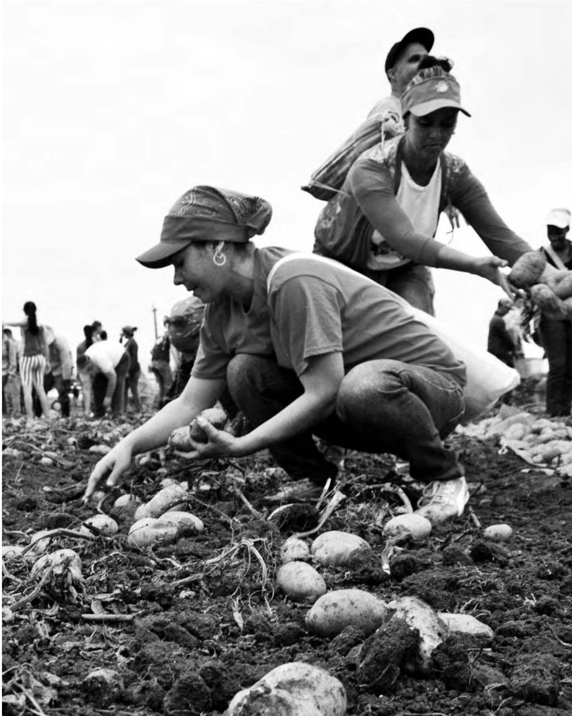
Jóvenes participantes en el I Activo Nacional de Jóvenes Agropecuarios, desarrollan una jornada de trabajo en los campos de papa de la Empresa de Cultivos Varios La Cuba, en Ciego de Ávila.

“La política de precios establece un margen de utilidad aprobado de hasta un 30% (en relación con el costo productivo) y, en condiciones excepcionales de acuerdo con las características del cultivo, puede llegar hasta un 50%”, puntualizó el directivo. Y aclaró que el Minag no define precios minoristas.