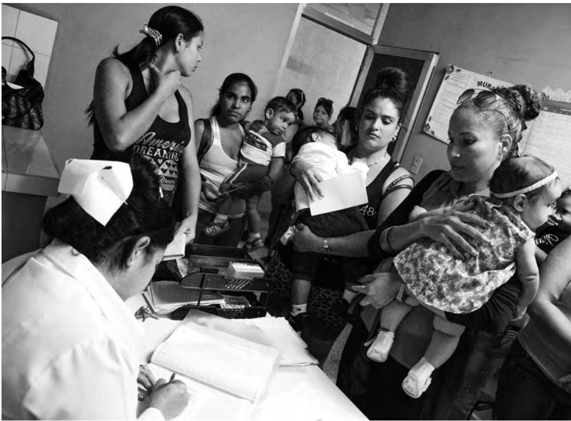
Vacunación de niñas y niños en el Policlínico Gustavo Alderguía, en Las Tunas.