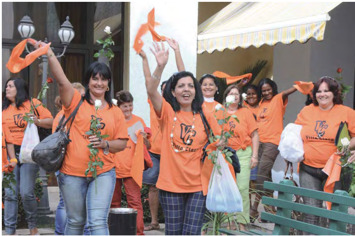
Delegadas de Villa Clara al IX Congreso de la Federación de Mujeres Cubanas (FMC).

Aunque es preciso continuar el trabajo lento pero seguro contra el pensamiento machista —en lo cual la Federación de Mujeres Cubanas es un pilar fundamental— la mujer cubana asciende cada vez más a ocupar el lugar que le corresponde en una sociedad que a partir del siglo XIX comenzó a construir, desde la independencia nacional y posteriormente desde el triunfo de la Revolución.