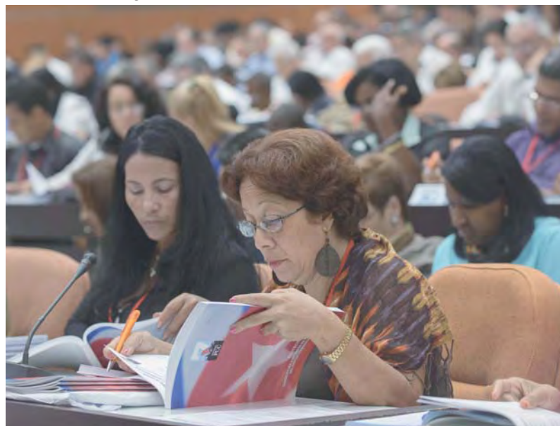
Delegadas al VII Congreso del Partido Comunista de Cuba estudian la candidatura al Comité Central del Partido.

cia y control, o la poca previsión e iniciativa de cuadros y funcionarios. Propiedad pública mayoritaria. La pequeña empresa privada, el cuentapropismo y la cooperativas no son en esencia “antisocialistas” –afirmó–, aunque seguirán siendo un complemento en la economía, donde prevalecerá la propiedad social y estatal de los medios fundamentales de producción. En estos se seguirá profundizando la autonomía de las empresas, para que sean más eficientes, generen mayores ingresos para sus trabajadoras y trabajadores, y fortalezcan el sentido de propiedad de estos. Límites del mercado. Si en los Lineamientos aprobados en 2011 no se permitía la “acumulación de propiedad” por parte de agentes privados, ahora se le añade “de riqueza”, en alusión clara al objetivo de evitar desigualdades sangrantes y marcar límites bien definidos. El Estado y la militancia –dijo– no pueden quedarse de “brazos cruzados” ante el afán de ganancia, como en el caso de los actuales altos precios de los alimentos en el país. China y Vietnam. El presidente reconoció a estos países como referentes