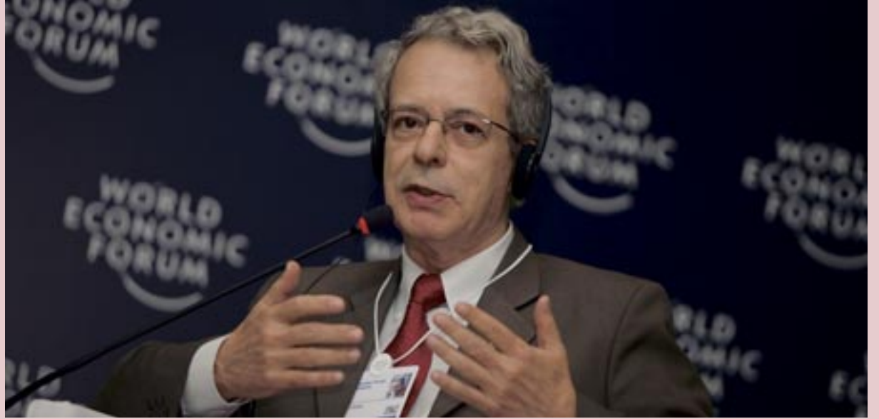
FOTO: FREI BETTO EN EL WORLD ECONOMIC FORUM ON THE LATIN AMERICA 2009, RIO DE JANEIRO. FOTO: WORLD ECONOMIC FORUM / FLICKR.

Entre 1986 y 2009, el país importó unas 33.000 toneladas de productos pesqueros. Debido a los niveles de financiación requeridos, no ha sido posible mantener este volumen. Como consecuencia de esta situación, en Cuba se fomenta la acuicultura con un programa que incluye todas las regiones del país. Entre los cultivos, se desarrolla la acuicultura extensiva, ya que la acuicultura intensiva demanda volúmenes de alimentos que actualmente