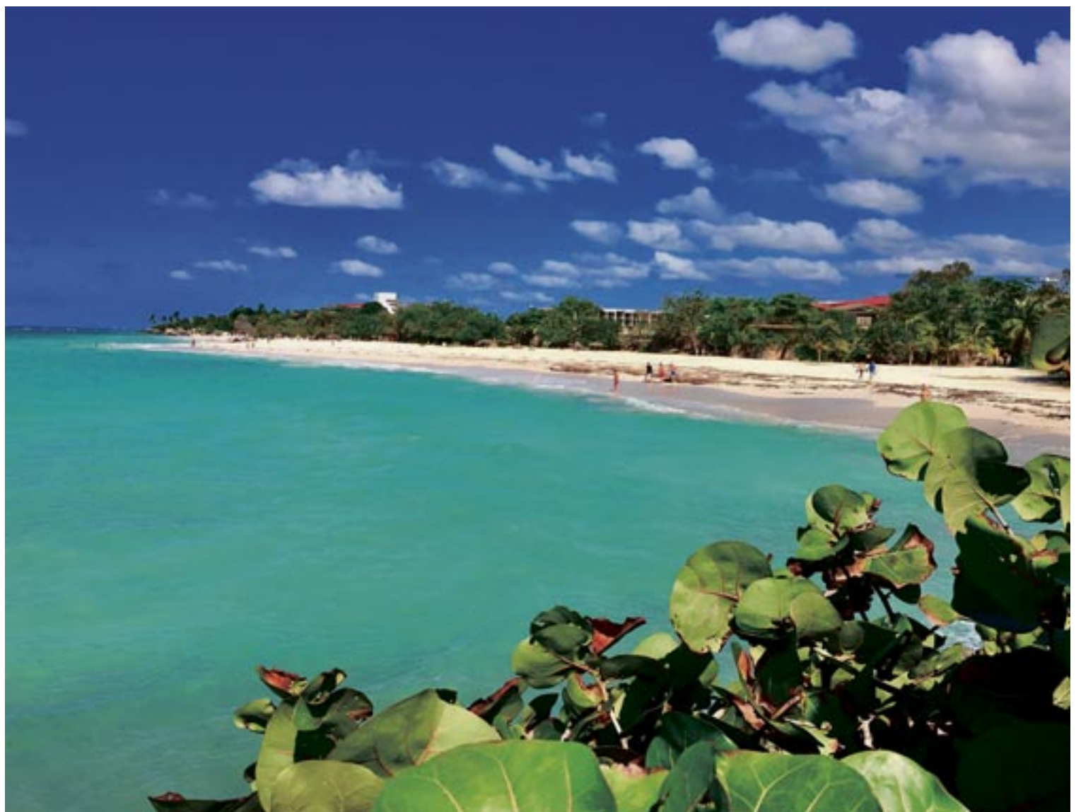
PLAYA DE GIBARA. HOLGUÍN (CUBA).

Llegar a un número de visitantes y turistas similar al de los años previos a la pandemia es clave para que, en Cuba, puedan recuperarse programas públicos debilitados o superar la escasez. No es una cues-