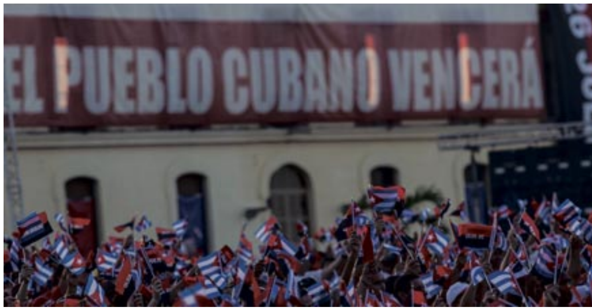
SANCTI SPIRITUS EN 26.

Para construir esta narrativa, apelan a actores de la contrarrevolución que pudiéramos denominar como "tradicionales", pero también a nuevos operadores, orientados a sectores poblacionales donde la crisis económica, la ideología