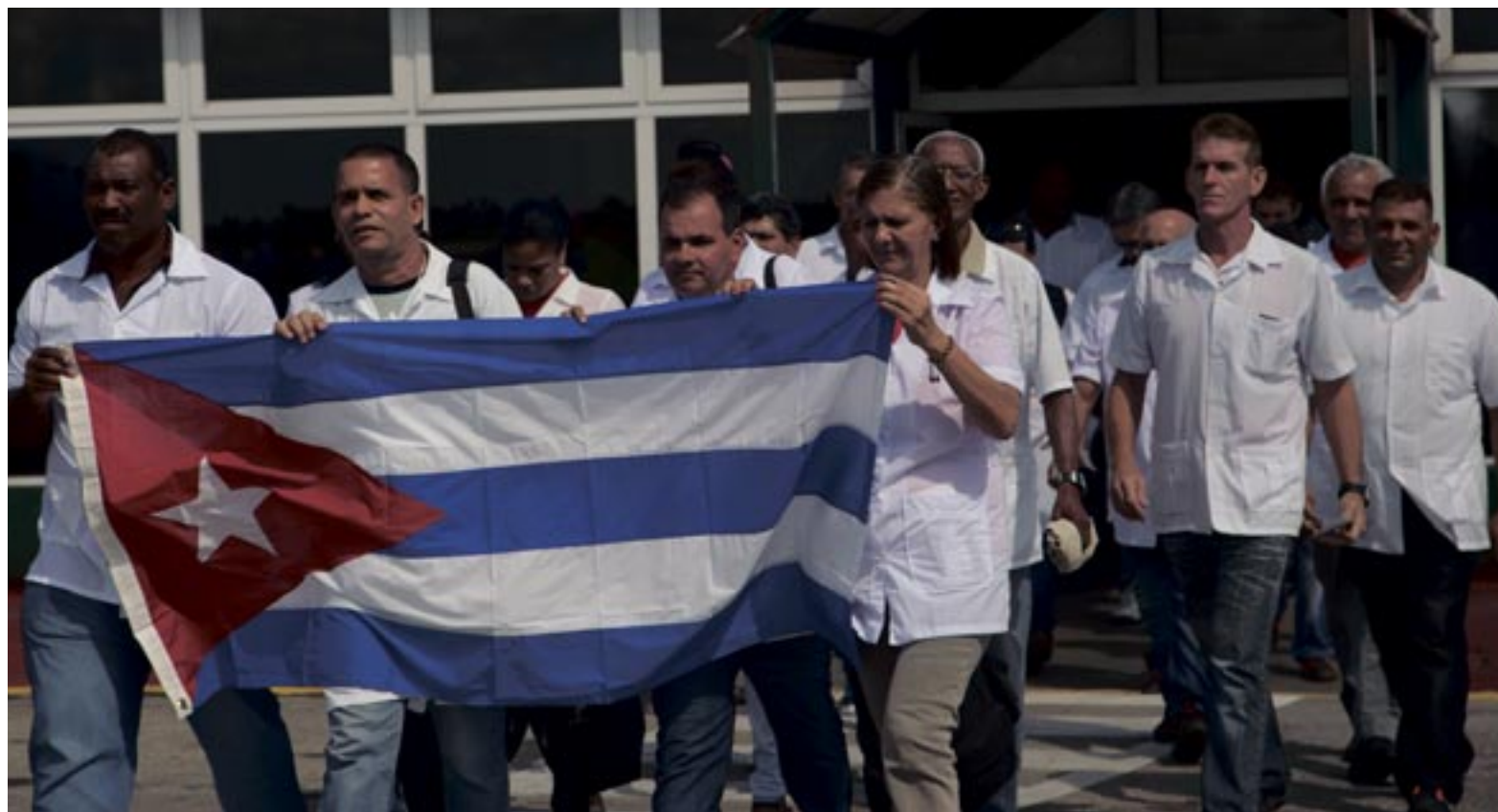
MÉDICAS Y MÉDICOS CUBANOS PARTEN A HAITÍ PARA AYUDAR A LAS VÍCTIMAS DEL HURACÁN MATTHEW.

Numerosas fuentes académicas y especialistas de Naciones Unidas cali-