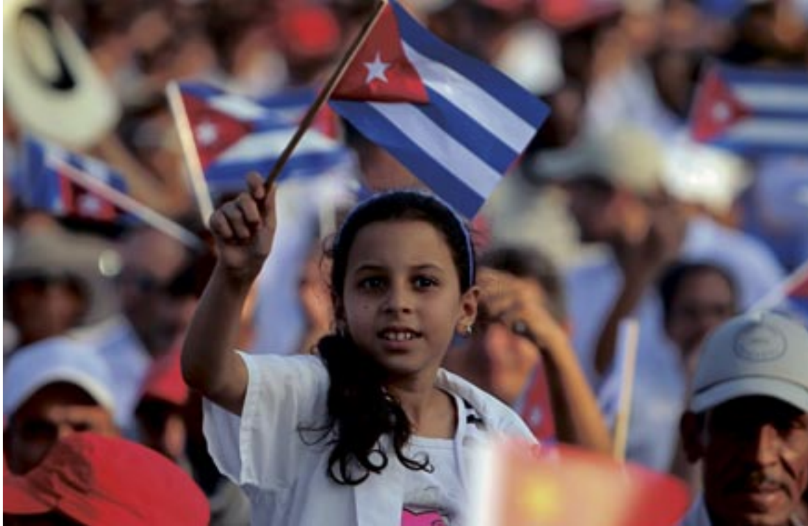
UN PRIMERO DE MAYO EN LA HABANA.

Cuba no tiene una sola medida en pie que agrade a EEUU, sus instituciones o ciudadanos, y no gasta millones en intervenir en sus asuntos internos, que no andan nada bien por cierto.