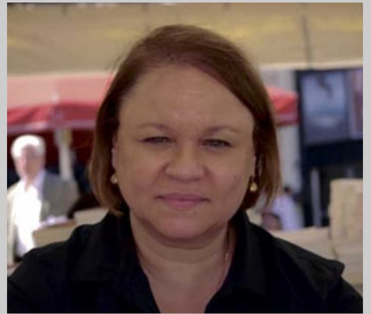
ZOÉ VALDÉS.

Entonces, a quienes promueven el bloqueo contra Cuba... ¿se les puede llamar "criminales de guerra"?