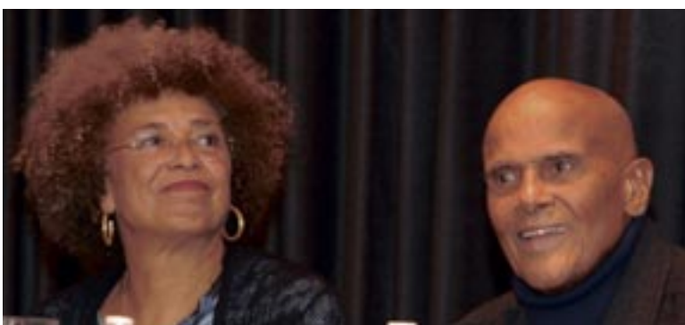
HARRY BELAFONTE, JUNTO A ANGELA DAVIS.

En abril de este año fallecía el cantante, actor y productor estadounidense Harry Belafonte, y las notas enfatizaban su "activismo por los derechos sociales y causas humanitarias"; su participación, junto a Martin Luther King,