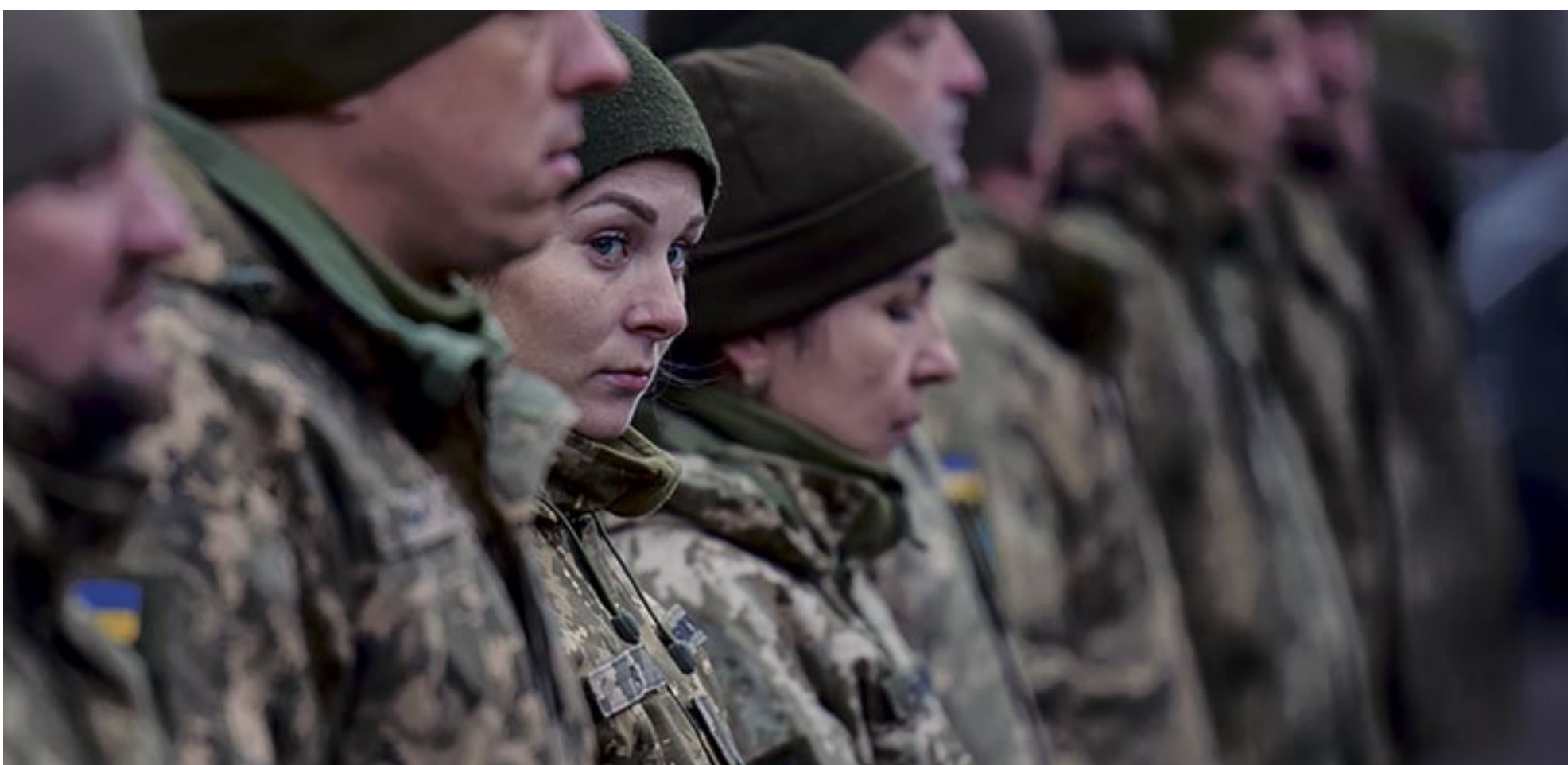
TROPAS UCRANIANAS.

Que es puro fake . Que, sencillamente, no es más que una nueva operación de guerra psicológica. Dinamitada, una vez más, desde Cuba.