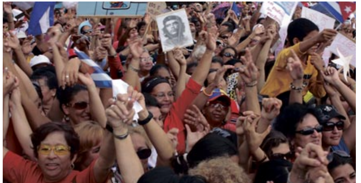
ACTO DE LA FEDERACIÓN DE MUJERES CUBANAS EN HOLGUÍN.

Lo que más me entristece es la preferencia por culpar a la víctima y cerrar los ojos y la boca ante la desvergüenza y el abuso del que atropella a nuestra Patria, eso estimula a quienes hoy se oponen a levantar las medidas de asfixia.