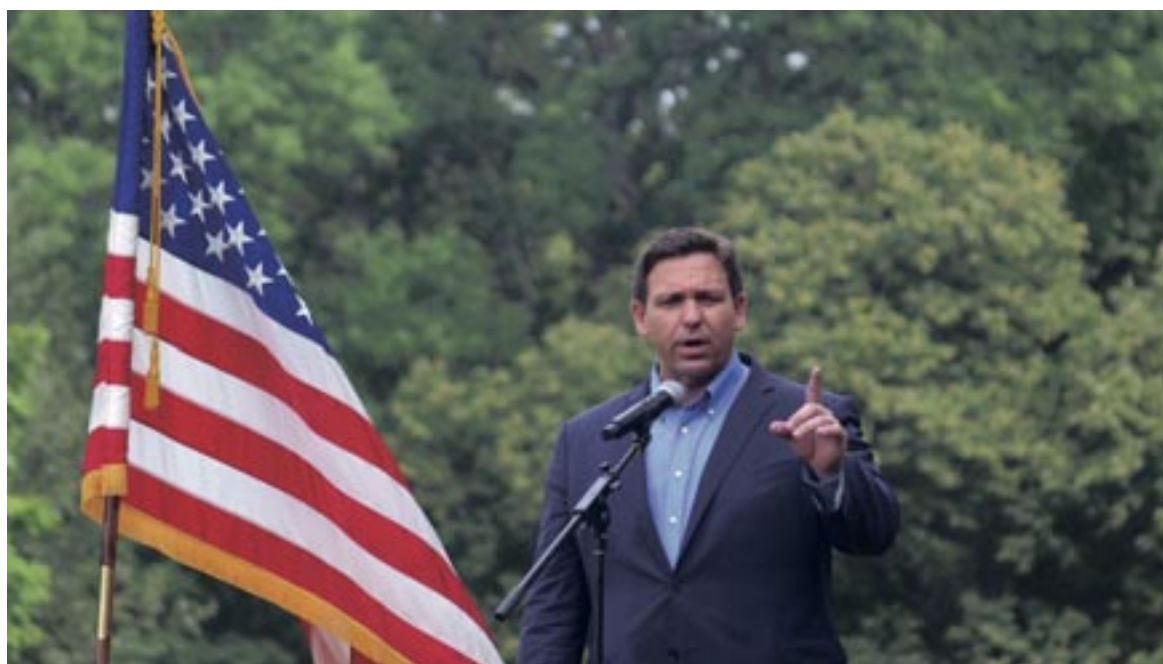
EL GOBERNADOR DE FLORIDA RON DESANTIS.

En el diario español El País leíamos un reportaje sobre los viajes de las “mulas” con “cocaína desde Perú a España”, en los que estaría implicado el personal del aeropuerto de Lima. Ahora imaginen que ese aeropuerto fuera el de La Habana. Y verían entonces pasar a titula-