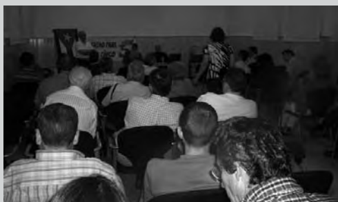
16 mayo. Málaga. Conferencia «Situación actual de Cuba y el caso de Los Cinco» (Asociación de Amistad Hispano-Cubana de Málaga)