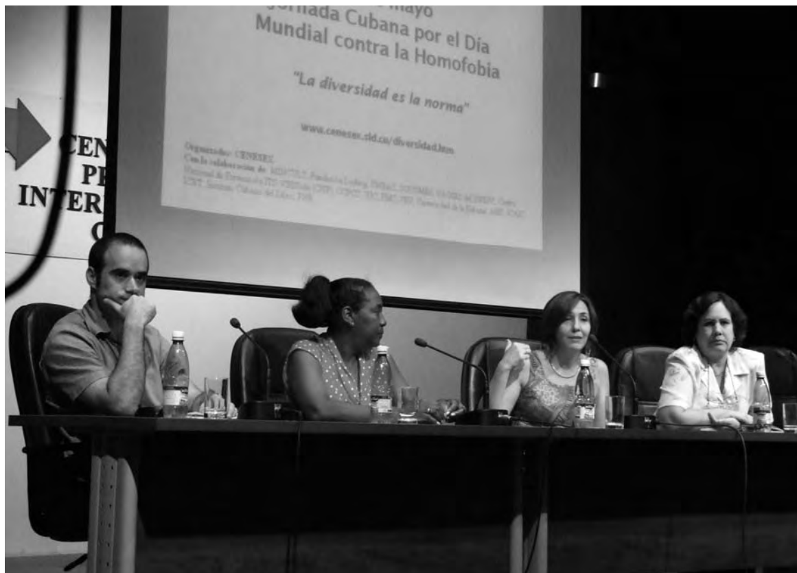
Mariela Castro y representantes del CENESEX anunciando los actos por el Día Mundial contra la Homofobia.

- La FMC sobre todo tiene muy estrechos y antiguos vínculos con el movimiento feminista, con organizaciones de mujeres a nivel mundial. Al principio, a la FMC no le gustaba autodefinirse como organización feminista, porque existían diferentes tendencias, a veces muy extremistas, que se enfrentaban al hombre en vez de sumarlo a la tarea de cambiar el mundo, y la FMC siempre dijo que era una organización de mujeres que invitaba al hombre a participar y trabajar jun-