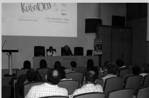
19-23 mayo. Bilbao, Donostia-San Sebastián y Bilbao. Jornadas "Cuba: diversidad y cultura. La voz de la intelectualidad cubana" (Asociación Euskadi-Cuba)