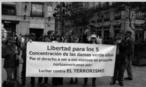
12 mayo. Puerta del Sol de Madrid. Concentración de las "Damas de verde olivo" (Asociación comunidad cubana de Madrid "Sierra Maestra")