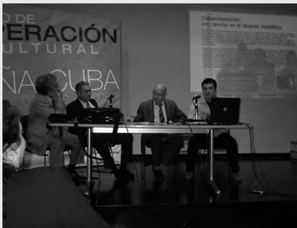
29 de abril. Getafe. Presentación de CUBAINFORMACIÓN en el Encuentro de Cooperación Cultural España-Cuba