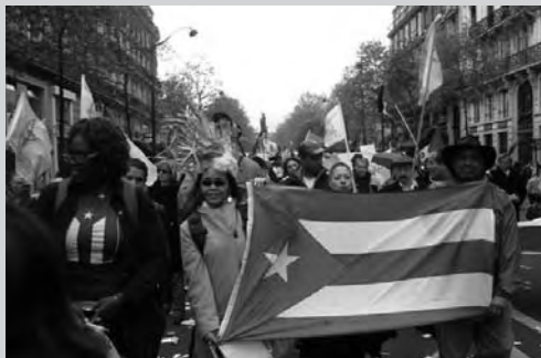
1 mayo. París. La comunidad cubana participa en manifestación por el Día del Trabajo (Asociación "Raíces Cubanas")