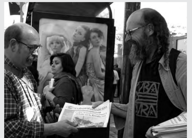
1 mayo. La revista CUBAINFORMACIÓN fue repartida en numerosas ciudades en las manifestaciones por el 1 de mayo.