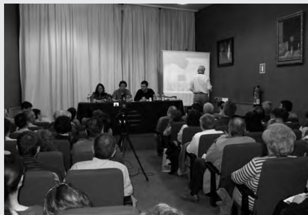
29 de abril. Ateneo de Madrid. Presentación de CUBAINFORMACIÓN en el acto "Manipulación mediática contra Cuba"