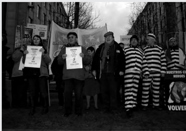
Acto en Bruselas: Yes you can!