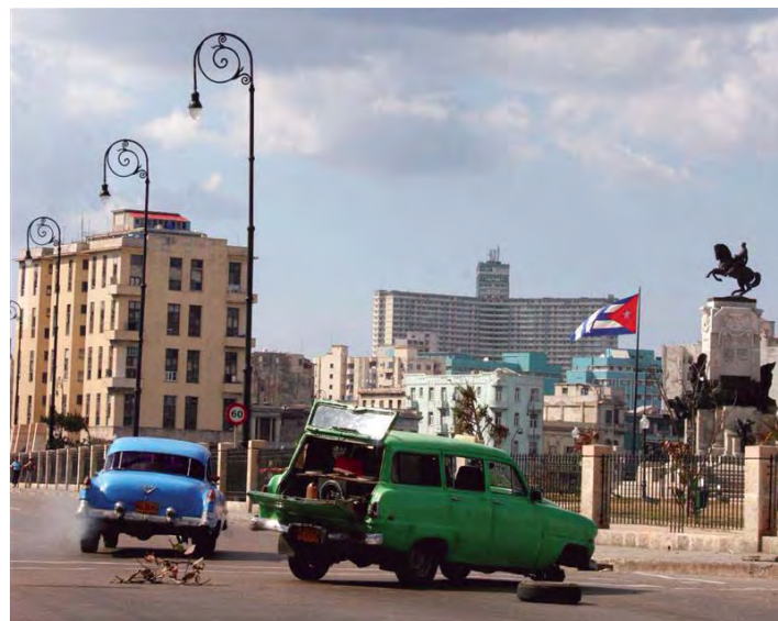
Primer premio: Andrei Reynaldo

Premios concedidos en el 6º Concurso de Fotografía CUBAINFORMACIÓN (fallado el 20 de noviembre de 2008)