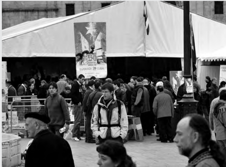
Fiesta en Bilbao por los 50 años de la Revolución.

Además, coincidiendo con la investidura del nuevo presidente de Estados Unidos, varios colectivos convocaron concentraciones frente a la sedes diplomáticas de dicho país, bajo el lema "Yes you can, Obama", para exigir al nuevo ejecutivo norteamericano el fin del bloqueo a Cuba y la liberación de los cinco cubanos presos políticos en las cárceles de Estados Unidos. El día 10 de enero fue convocada en Madrid, por la Asociación "Sierra Maestra" (asociación de cubanos y cubanas residentes en Madrid) y el 20 de enero en Bruselas, por el grupo Iniciativa Cuba Socialista.