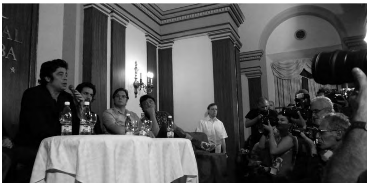
Actores y productores de la película, encabezados por Benicio del Toro, en el Hotel Nacional.

Mejor Cartel: « Titón, de La Habana a Guantánamera, 1928-1996 » de Carmen Población (Cuba)