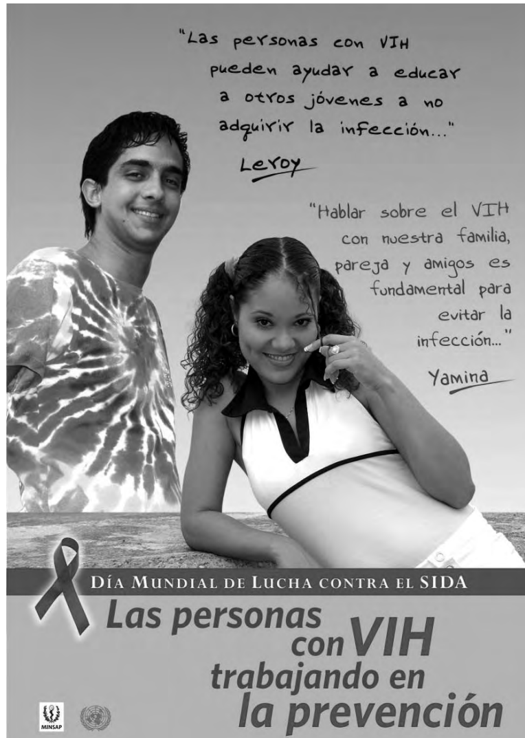
Cartel editado por el MINSAP para el día de lucha contra el Sida.

- Sí, surgió la consejería telefónica a través de la “Línea de ayuda”, la primera que tuvo el país. Al principio estábamos escépticos, no sabíamos