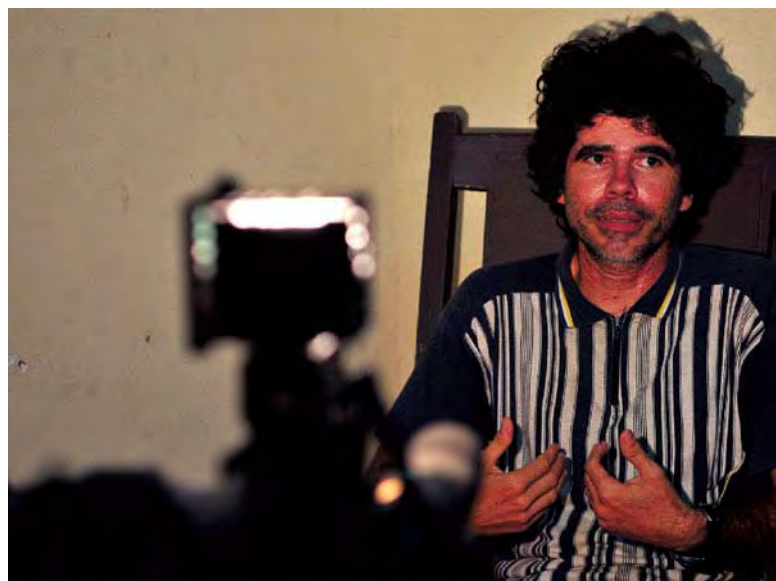
Gorki Ávila, el “rockero disidente”, una de las últimas creaciones mediáticas.

cuanto elimina aspectos fundamentales para la comprensión de la información, como el contexto geográfico, las claves históricas y todo tipo de datos macro sobre el desarrollo económico y social de la Isla.