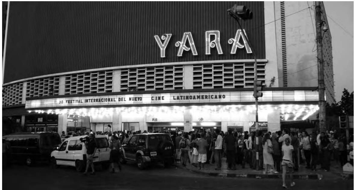
Estreno en el Yara de las dos partes de la película de Steven Soderbergh sobre el Che, el 6 de diciembre.

mericano Steven Soderbergh a los últimos años de la vida de Ernesto Guevara, que conmocionó al público que más de cerca conoce la obra y el legado del Che. La presencia en la première de buena parte del elenco técnico y artístico (encabezado por el gran actor portorriqueño y protagonista del film, Benicio del Toro) se convertiría en el momento culminante de unas jornadas mágicas y